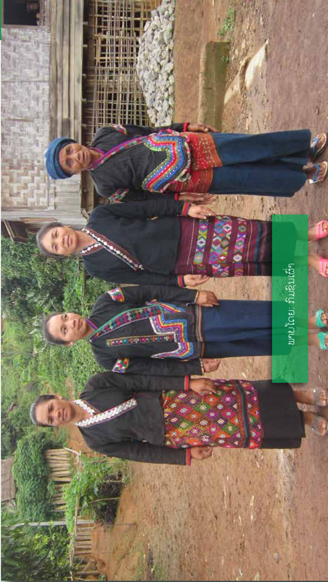
ພາບໂດຍ: វົມឌុນເພົា