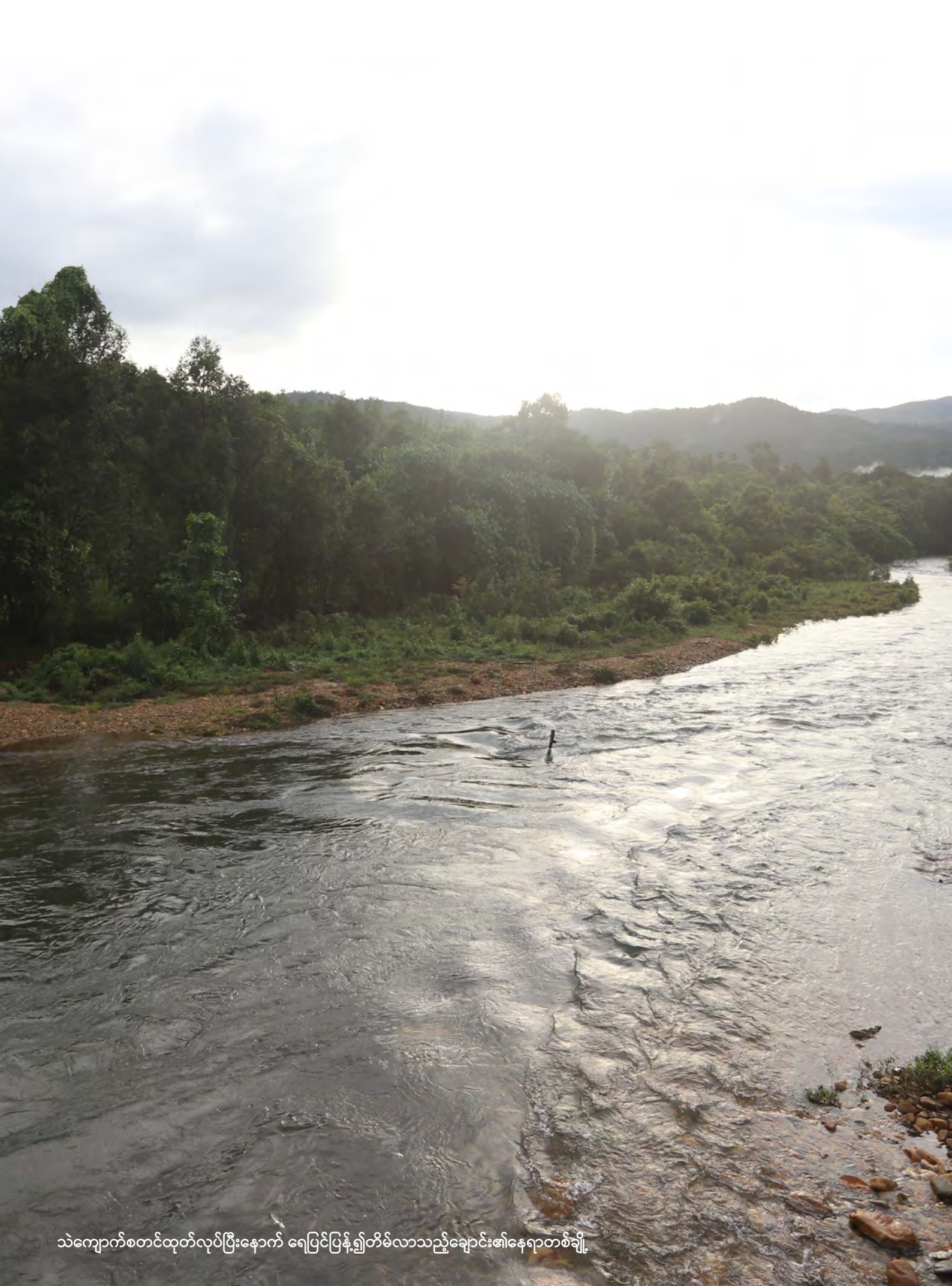
သဲကျောက်စတင်ထုတ်လုပ်ပြီးနောက် ရေပြင်ပြန့်၍တိမ်လာသည့်ချောင်း၏နေရာတစ်ချို့