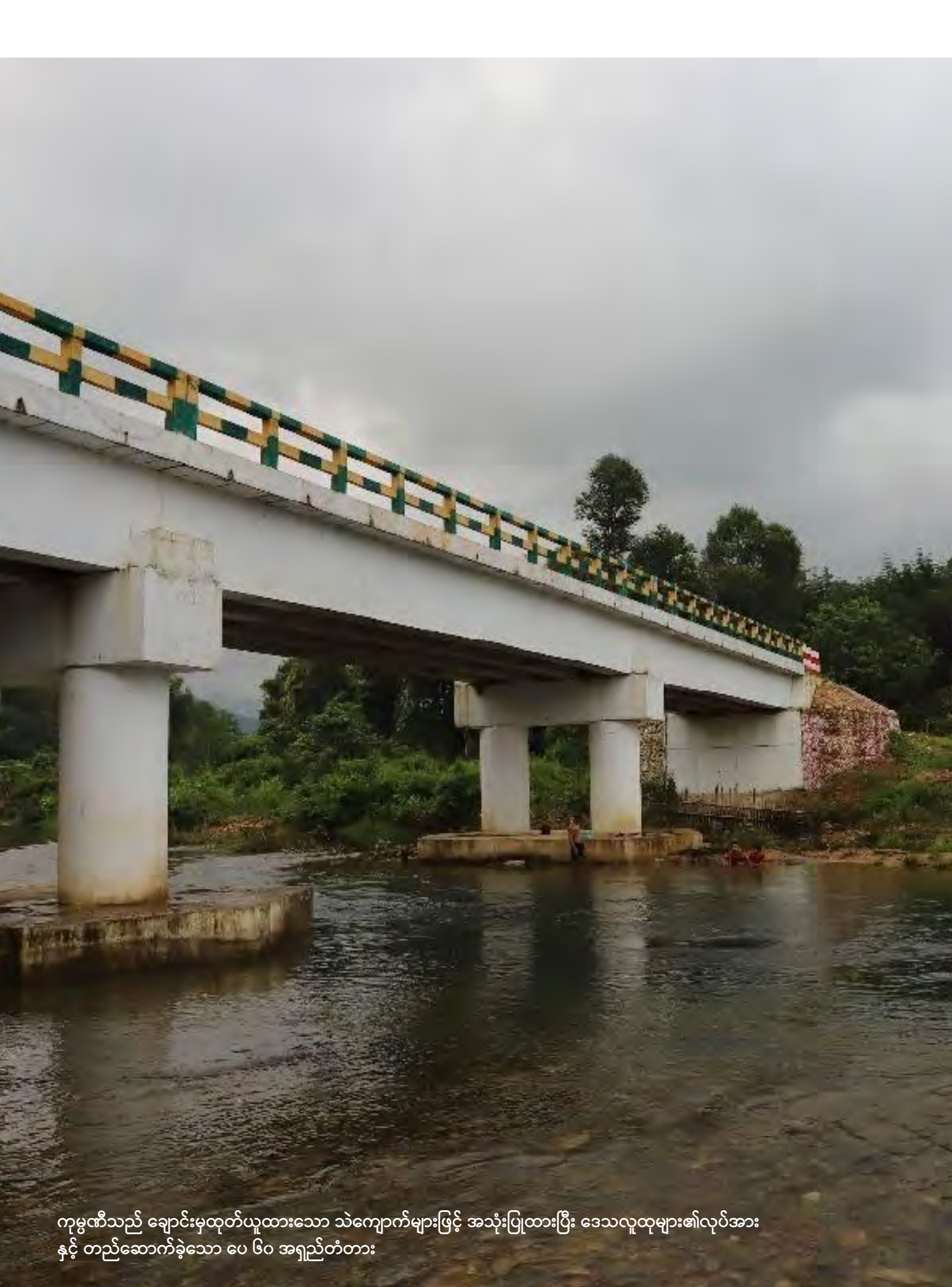
ကုမ္ပဏီသည် ချောင်းမှထုတ်ယူထားသော သဲကျောက်များဖြင့် အသုံးပြုထားပြီး ဒေသလူထုများ၏လုပ်အား နှင့် တည်ဆောက်ခဲ့သော ပေ ၆၀ အရှည်တံတား