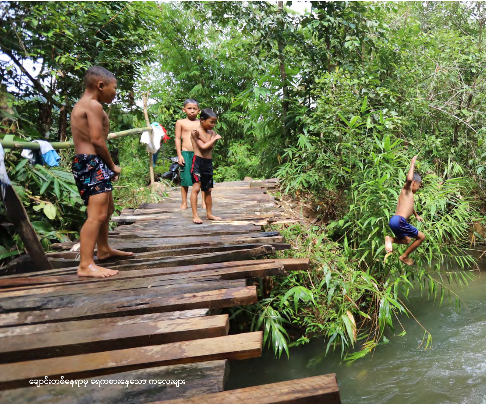
ချောင်းတစ်နေရာမှ ရေကစားနေသော ကလေးများ