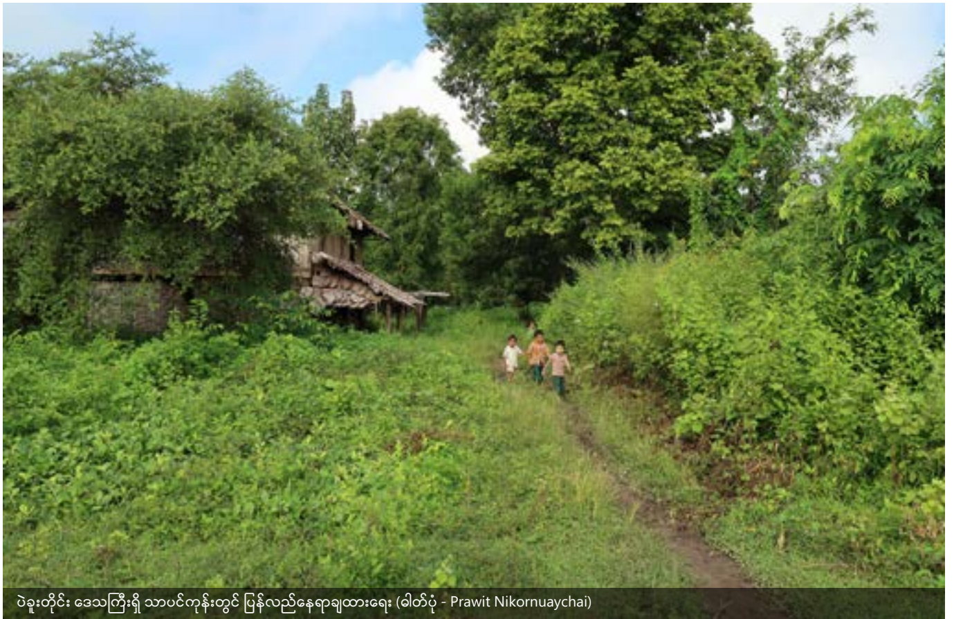
ပဲခူးတိုင်း ဒေသကြီးရှိ သာပင်ကုန်းတွင် ပြန်လည်နေရာချထားရေး