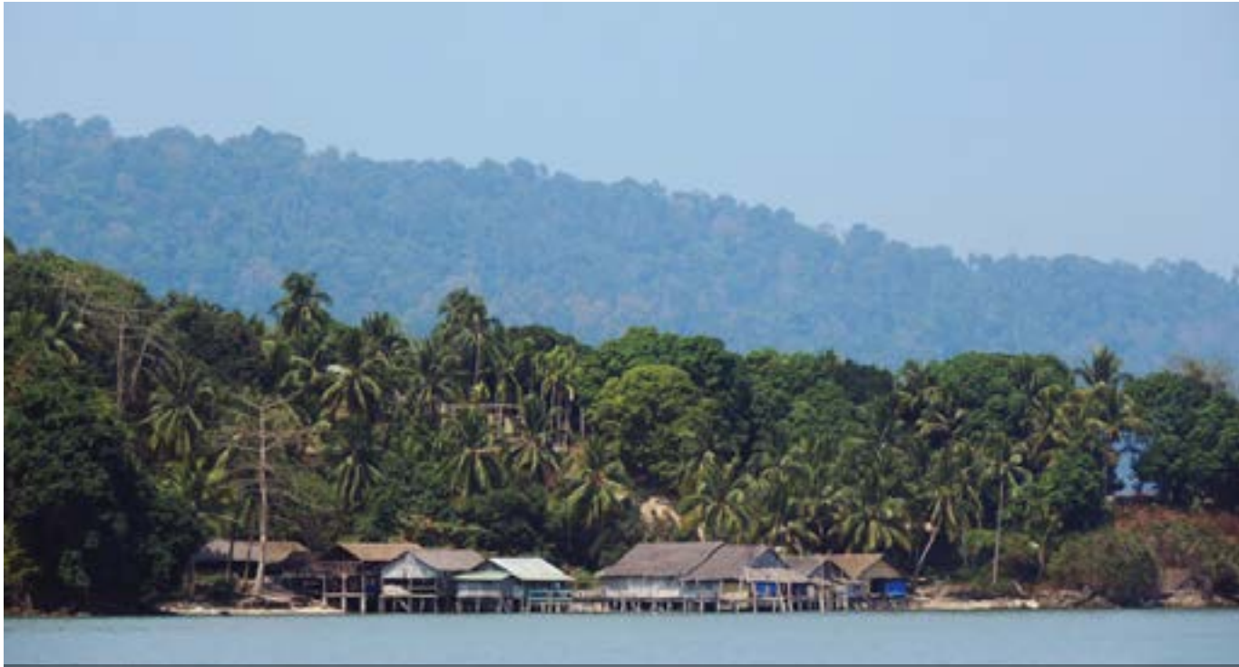
မြိတ်ကျွန်းစုရှိ ဆလုံ ကျေးရွာ (ရိတ်ပုံ - Axel Drainville_Flickr)

ကနဦး မြေရှင်းလင်းခြင်းသည် ဓလေ့ထုံးတမ်းဆိုင်ရာလုပ်ကိုင်ပိုင်ဆိုင်မှုစနစ်အခွင့်အရေးများကို ဆုံးဖြတ်ရာတွင် အဓိကအချက်တစ်ခုဖြစ်ပြီး တောင်တန်းဒေသရှိ လူ့အဖွဲ့အစည်းများတွင်လည်း များစွာတွေ့ရသည်။ သို့သော် ထိုအချက်နှင့်တကွ ပူးတွဲပါလာသည့် တိုင်းရင်းသားတို့ ကျင့်သုံးသော စည်းမျဉ်းမှာ ဒေသခံလူ့အဖွဲ့အစည်းတွင် နေထိုင်သူများအားလုံးသည် အဆိုပါ မြေတွင် ဝင်ရောက်ခွင့်ရှိသည်။ သူကြီးဦးစီးသည့် ကျေးရွာများတွင် သူကြီးနှင့် သူ၏မျိုးနွယ်စု (ကျေးရွာတည်ထောင်သူ၏ မျိုးဆက်များ)သည် အဆိုပါမြေများနှင့် ပတ်သက်လျှင် ဦးစားပေးအခွင့်အရေးရရှိနိုင်သည်။ အချို့သော အခြေအနေများတွင် သူကြီးသည် ကျေးရွာ၏ နယ်မြေအားလုံးကို ထိန်းချုပ်နိုင်ပြီး ၎င်းအား မြေပိုင်ရှင်အဖြစ်သတ်မှတ်နိုင်သည်။ သို့သော် တောင်တန်းဒေသရှိ မြေယာ အခွင့်အရေး၊ အခန်းကဏ္ဍ နှင့် ရိုးရာသူကြီး၏ တာဝန်များ၏ သဘောသဘာဝမှာ ဂေါပက အဖွဲ့နှင့် တူညီပြီး ကျေးရွာကိုယ်စား မြေများကို စီမံခန့်ခွဲခြင်း ဖြစ်သည်။ ကိုလိုနီခေတ် (ကိုလိုနီခေတ်လွန်) တွင် နိုင်ငံတော်မှ ဓလေ့ထုံးတမ်းဆိုင်ရာ ဥပဒေများနှင့် နိုင်ငံရေး စုဖွဲ့မှုများကို မြေပြန့်တွင်သာ မက တောင်တန်းဒေသများတွင်လည်း ပြန့်လည် ပြောင်းလဲခဲ့သည်။ ဤအကြောင်းအရာကို နိုင်ငံတော်၏ ကြားဝင်ဆောင်ရွက်မှုဆိုသည့် အခန်းအောက်တွင် အကျဉ်းချုံးဆွေးနွေးသွားမည်။