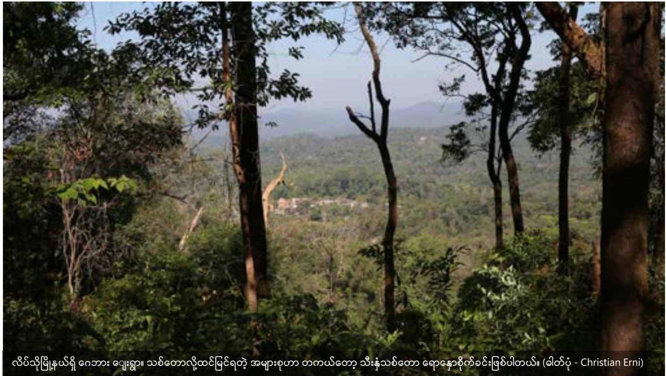
လိပ်သိုမြို့နယ်ရှိ ဂေဘား မျေးရွာ။ သစ်တောလို့ထင်မြင်ရတဲ့ အများစုဟာ တကယ်တော့ သီးနှံသစ်တော ရောနှောစိုက်ခင်းဖြစ်ပါတယ်။

မည်မျှရှိသည်ကို သုံးသပ်၍ တစ်စိတ်တစ်ပိုင်းသာ ဖြစ်သော စနစ်နှင့် ပြီးပြည့်စုံသောစနစ်များအကြား အခြေခံခွဲခြားမှုပြုလုပ်ရန် အဆိုပြုသည်။ ဤအစီရင်ခံစာတွင် ပါဝင်သော ဖြစ်ရပ်လေ့လာဆန်းစစ်မှုများကို ဓလေ့ထုံးတမ်းဆိုင်ရာ လုပ်ကိုင်ပိုင်ဆိုင်မှုအရ ပြီးပြည့်စုံသောစနစ်၊ ဓလေ့ထုံးတမ်းဆိုင်ရာ လုပ်ကိုင်ပိုင်ဆိုင်မှုအရ တစ်စိတ်တစ်ပိုင်းသာဖြစ်သောစနစ်နှင့် ဓလေ့ထုံးတမ်းဆိုင်ရာ လုပ်ကိုင်ပိုင်ဆိုင်မှု ပျောက်ကွယ်သွားပြီး ဖြစ်သောစနစ်ဟူ၍ အစဉ်လိုက်ခွဲခြား၍ အောက်တွင် ဖော်ပြထားသည့် ပုံ (၁) တွင် တင်ပြထားသည်။ သို့သော် လက်တွေ့တွင် ကြုံတွေ့ရသည့် ဓလေ့ထုံးတမ်းဆိုင်ရာ လုပ်ကိုင်ပိုင်ဆိုင်မှု စနစ်၏ ကွဲပြားခြားနားမှုအားလုံးကို ခြုံငုံနိုင်မည်မဟုတ်ပါ။ ဓလေ့ထုံးတမ်းဆိုင်ရာ လုပ်ကိုင်ပိုင်ဆိုင်မှု စနစ်များ၏ သဘာဝအရနှင့် ပြဿနာဖြစ်ပွား အကြောင်းအရင်းများနှင့် ပြောင်းလဲမှုကို ပြုလုပ်သူတို့၏ အခြေအနေအရ တစ်ခါတစ်ရံတွင် တစ်စိတ်တစ်ပိုင်းသာဖြစ်သောစနစ်နှင့် ပြီးပြည့်စုံသောစနစ်များအကြား ခွဲခြားရန် ခက်ခဲလှသည်။ သို့သော် ထိုသို့သော ကွဲပြားမှုကို ဖော်ထုတ်ခြင်းဖြင့် ဓလေ့ထုံးတမ်းဆိုင်ရာ လုပ်ကိုင်ပိုင်ဆိုင်မှုစနစ်များကို ကာကွယ်ရန် လိုအပ်သည့် ယန္တရားများကို ရှာဖွေရန် အထောက်အကူပြုနိုင်မည်ဖြစ်သည်။