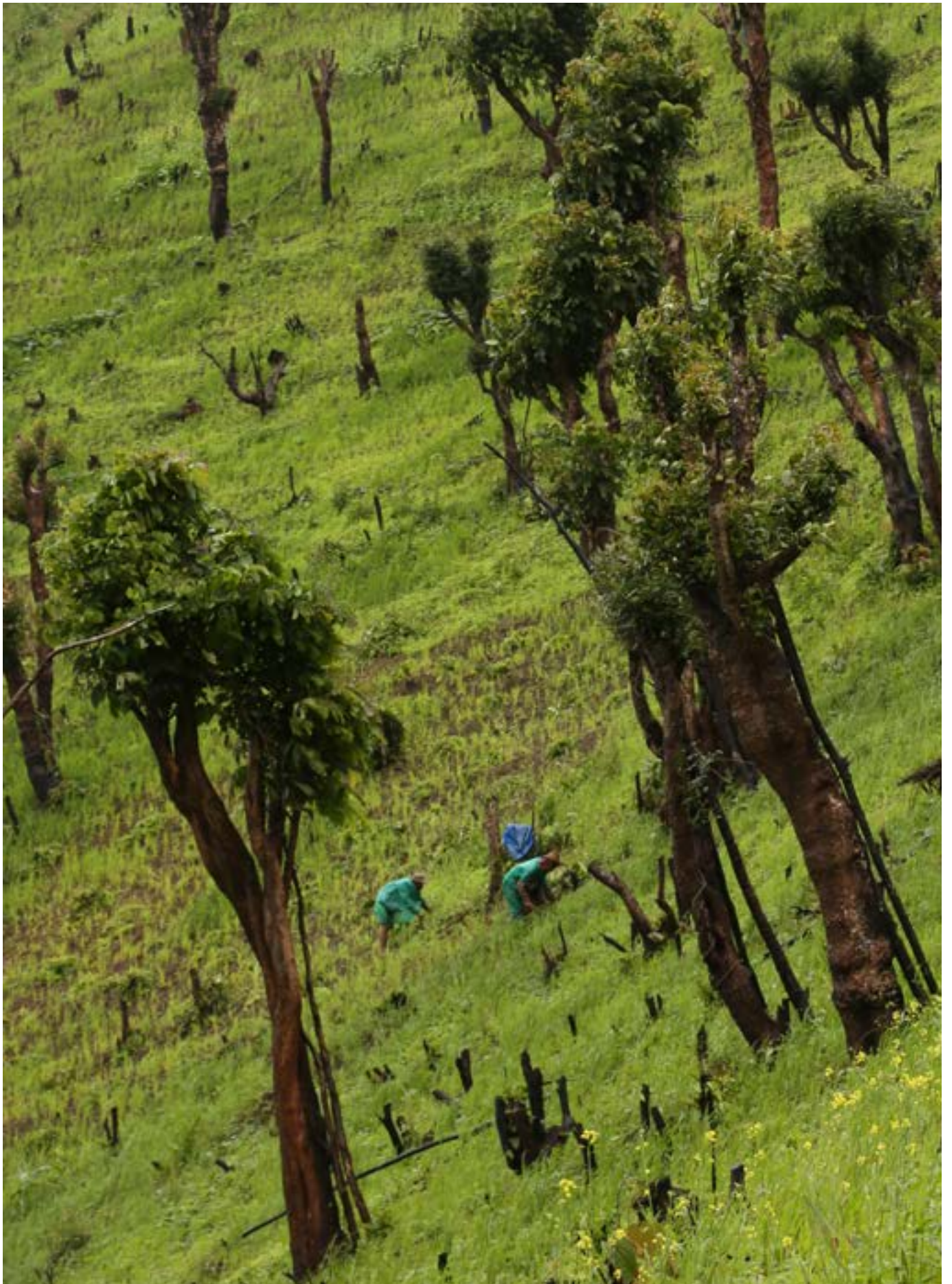
မျိုးနွယ်စုများနှင့် တစ်ဦးချင်း ပိုင်ဆိုင်သည့် မြေများပေါ်တွင်ရှိသည့် ကယားပြည်နယ် ခူးပရာ ကျေးရွာ လူထုများ၏ ရွှေ့ပြောင်းတောင်ယာ စိုက်ပျိုးကွင်း