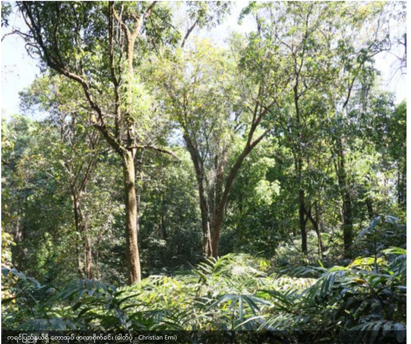
ကရင်ပြည်နယ်ရှိ တောအုပ် ဖာလာစိုက်ခင်း

ဤလေ့လာဆန်းစစ်မှုမှ ရရှိသည့် အဓိက သင်ခန်းစာမှာ ဓလေ့ ထုံးတမ်းဆိုင်ရာ လုပ်ကိုင်ပိုင်ဆိုင်မှု စနစ်များ၏ ထိရောက်မှုနှင့် ဒေသခံများအား ရရှိသည့် လုံခြုံရေးသည် လူဦးရေသိပ်သည်း မှု နည်းပါးခြင်း၊ စုပေါင်းအခွင့်အရေးများ ရှိခြင်း (သို့) အသက် မွေးဝမ်းကြောင်းစနစ်တစ်ခု (သို့) မြေယာအမျိုးအစားတွင် အခြေမခံဘဲ ဒေသခံ လူ့အဖွဲ့အစည်း၏ လုပ်ပိုင်ခွင့် ရှိမှုပေါ်တွင် သာ အခြေခံသည်။ မည်သည့်မြေယာတွင် မည်သည့် စနစ်ကို အသုံးပြုသည်ထက် လူထုအခြေပြု လုပ်ကိုင်ပိုင်ဆိုင်မှု စနစ်ကို ကာကွယ်ရန် လိုအပ်ကြောင်း Wiley က အကြံပြုသည် 148 ။ ထိုသို့ပြုလုပ်ရာတွင် မတူညီသော ဒေသခံလူ့အဖွဲ့အစည်း၏ နယ်နိမိတ်အတွင်းရှိ မတူညီသော မြေယာအမျိုးအစားအတွက် ကျင့်သုံးသော နည်းလမ်းများကို ထည့်သွင်းစဉ်းစားခြင်းထက် တစ်စိတ်တစ်ပိုင်းသာ ကျန်ရှိတော့သော ဓလေ့ထုံးတမ်းဆိုင်ရာ လုပ်ကိုင်ပိုင်ဆိုင်မှုစနစ်ပင်ဖြစ်လင့်ကစား ဒေသခံများ၏ နယ်နိ မိတ်ပေါ်တွင် ရှိသော မြေယာနှင့် အရင်းအမြစ်များနှင့် ပတ်သက် လျှင် လုပ်ပိုင်ခွင့် ရှိမှုကို အသိအမှတ်ပြုရမည်။