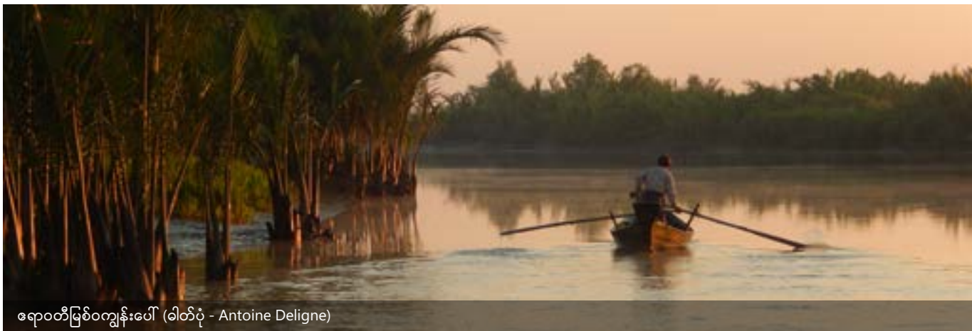
ဧရာဝတီမြစ်ဝကျွန်းပေါ်