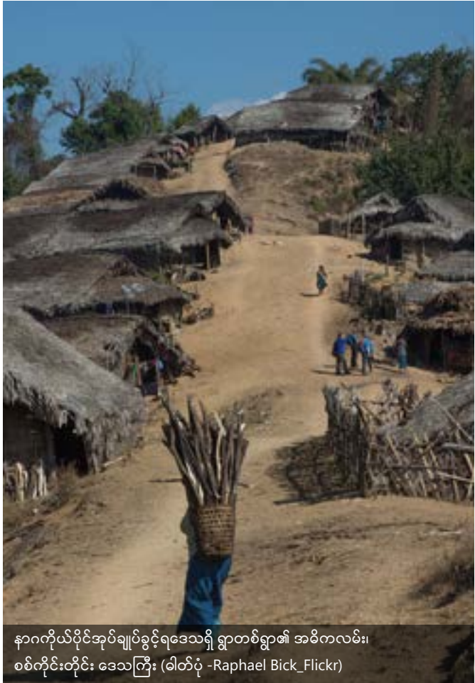
နာဂကိုယ်ပိုင်အုပ်ချုပ်ခွင့်ရဒေသရှိ ရွာတစ်ရွာ၏ အဓိကလမ်း၊ စစ်ကိုင်းတိုင်း ဒေသကြီး

ရွှေ့ပြောင်းတောင်ယာသည် အလှည့်ကျစိုက်ပျိုးသည့် စနစ်မျိုး ဖြစ်ပြီး လူဦးရေနည်းပါးသည့် တောင်တန်းဒေသများတွင် ယနေ့တိုင် ကျင့်သုံးလျက်ရှိသည်။ ဥပမာ - နာဂကိုယ်ပိုင်အုပ်ချုပ်ခွင့်ရဒေသ၊ ချင်းပြည်နယ်၊ ကချင်ပြည်နယ်၊ ကယားပြည်နယ်နှင့် ကရင်ပြည်နယ်တို့တွင် တွေ့ရသည်။ ရွှေ့ပြောင်းတောင်ယာများတွင် ရှုပ်ထွေးသော ဓလေ့ထုံးတမ်းဆိုင်ရာ လုပ်ကိုင်ပိုင်ဆိုင်ခွင့် စနစ်များရှိပြီး ထိုစနစ်အောက်တွင် သစ်တောများ (သို့) စားကျက်မြေများ နှင့် တောင်ယာမြေများကို စုပေါင်းပိုင်ဆိုင်မှုအဖြစ် ထားရှိကြသည်။ စုပေါင်းပိုင်ဆိုင်မှု ရှိသော်လည်း လူမှုအဖွဲ့အလိုက် ထိုပိုင်ဆိုင်မှုကို ရယူထားသူတို့သည် မတူညီကြပါ။ အခြား ထင်ရှားသော ပုံစံတစ်ခုမှာ တစ်ဦးချင်း (သို့) မျိုးနွယ်စုများမှ အမွေဆက်ခံခြင်းဖြင့် မြေယာပိုင်ဆိုင်ခွင့်ရယူခြင်း ဖြစ်သည်။ အထက်က ဖော်ပြခဲ့သည့် ဓားမဦးချန်ယာမ နှင့် တူသည်။ ရွှေ့ပြောင်းတောင်ယာစနစ်တွင် တစ်ဦးချင်းနှင့် အဖွဲ့အခွင့်အရေးများကို စုစည်းသည့် နည်းလမ်းများမှာ တိုင်းရင်းသားအလိုက် ကွာခြားသော်လည်း ဆုံးဖြတ်ချက်ချမှတ်မှုများကို စုပေါင်း၍ ဒေသခံ လူ့အဖွဲ့အစည်းအဆင့်တွင် ပြုလုပ်လေ့ရှိသည်။