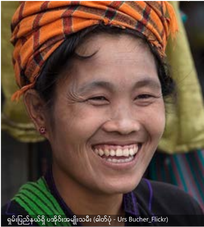
ရှမ်းပြည်နယ်ရှိ ပအိုဝ်းအမျိုးသမီး