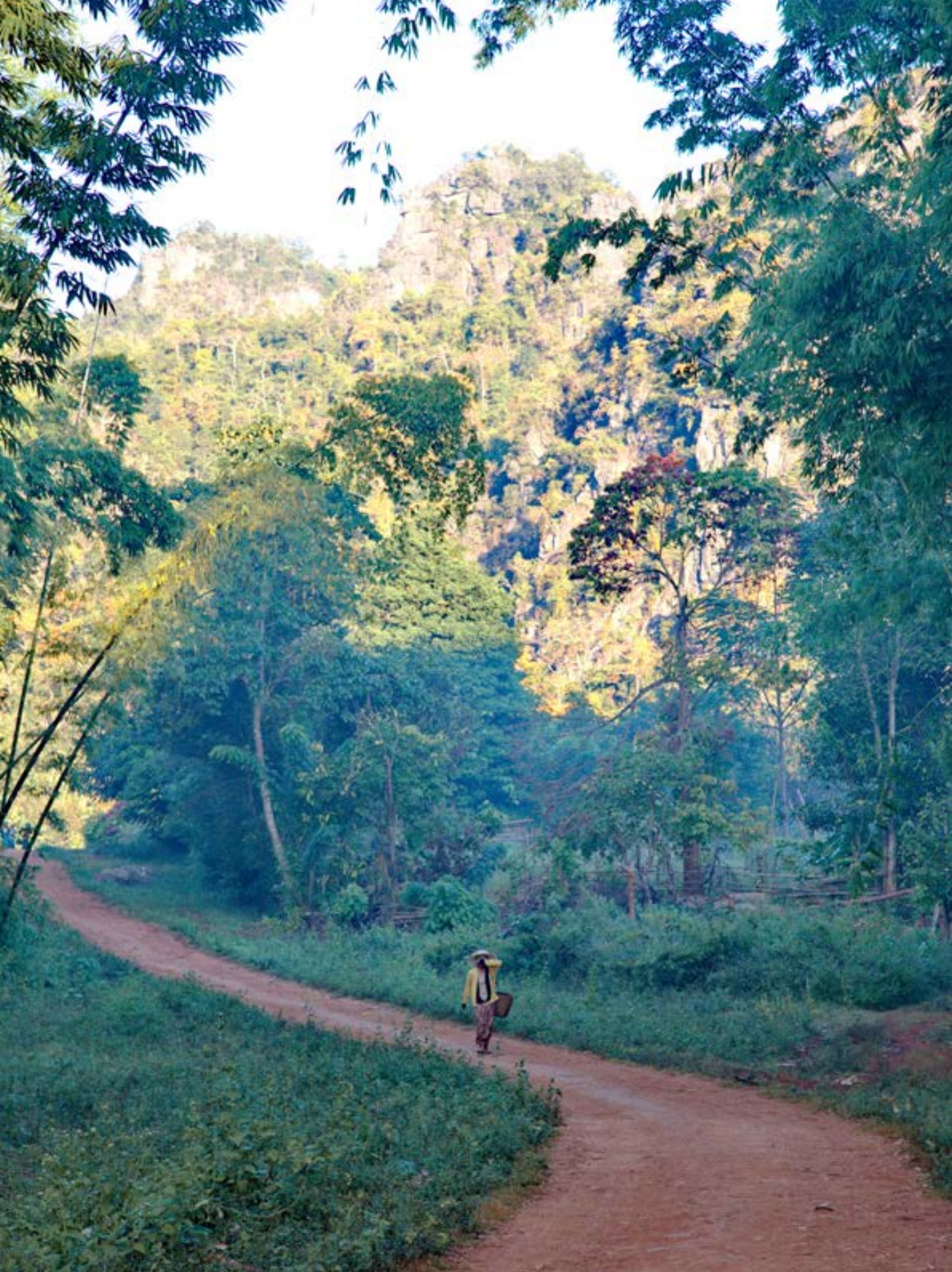
ထုံးကျောက်ချောက်ကမ်းပါးကို နောက်ခံထားပြီး ကယားပြည်နယ်ရှိ ကျိုင်းတုံရွာ သွားလမ်း။ ထုံးကျောက်များသည် အရေးကြီးသော အများသူငှာ ပိုင်ဆိုင်သည့် အရင်းအမြစ်တစ်ခုဖြစ်သည်။