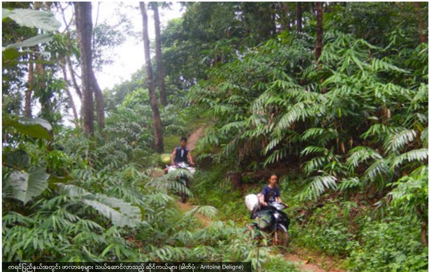
ကရင်ပြည်နယ်အတွင်း ဗာလာစေ့များ သယ်ဆောင်လာသည့် ဆိုင်ကယ်များ

ပြဋ္ဌာန်းဥပဒေနှင့် ဓလေ့ထုံးတမ်းဆိုင်ရာ ဥပဒေ နှစ်ရပ်စလုံး တွင် အခွင့်အရေးများကို တစ်ဦးချင်း၊ ပူးတွဲ (သို့) စုပေါင်း၍ ရယူ နိုင်သည်။ ဓလေ့ထုံးတမ်းဆိုင်ရာ လုပ်ကိုင်ပိုင်ဆိုင်ခွင့်နှင့် ပြဋ္ဌာန်း ဥပဒေတို့၏ ကွာခြားချက်မှာ ဓလေ့ထုံးတမ်းဆိုင်ရာ လုပ်ကိုင် ပိုင်ဆိုင်ခွင့်သည် ဒေသခံလူမှုအဖွဲ့အစည်းများတွင် အခြေခံခြင်း ဖြစ်သည်။ ဤသို့ရည်ညွှန်းဖော်ပြ ခြင်းအကြောင်းမှာ