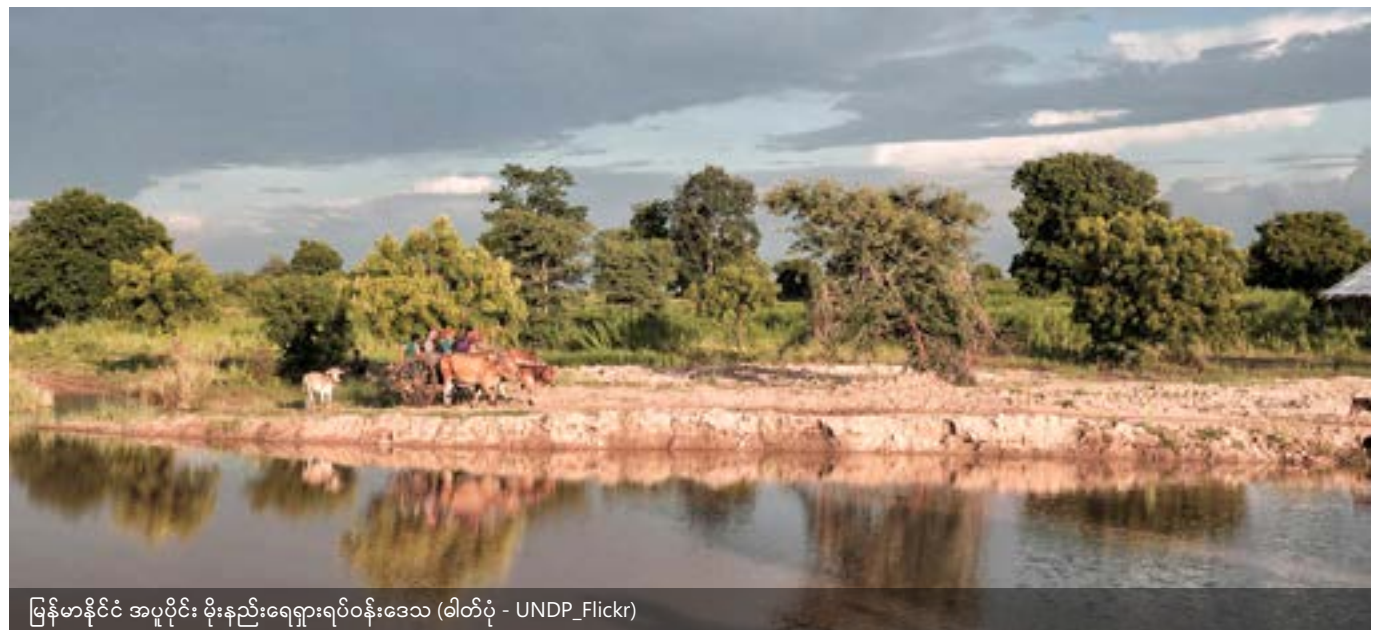
မြန်မာနိုင်ငံ အပူပိုင်း မိုးနည်းရေရှားရပ်ဝန်းဒေသ

မည်သို့ပင်ဆိုစေကာမူ ရပ်ရွာတစ်ခုလုံးတွင် LUCs များ တည်ရှိ ခြင်းသည် ဓလေ့ထုံးတမ်းဆိုင်ရာ လုပ်ပိုင်ခွင့်စနစ်များနှင့် ၎င်း