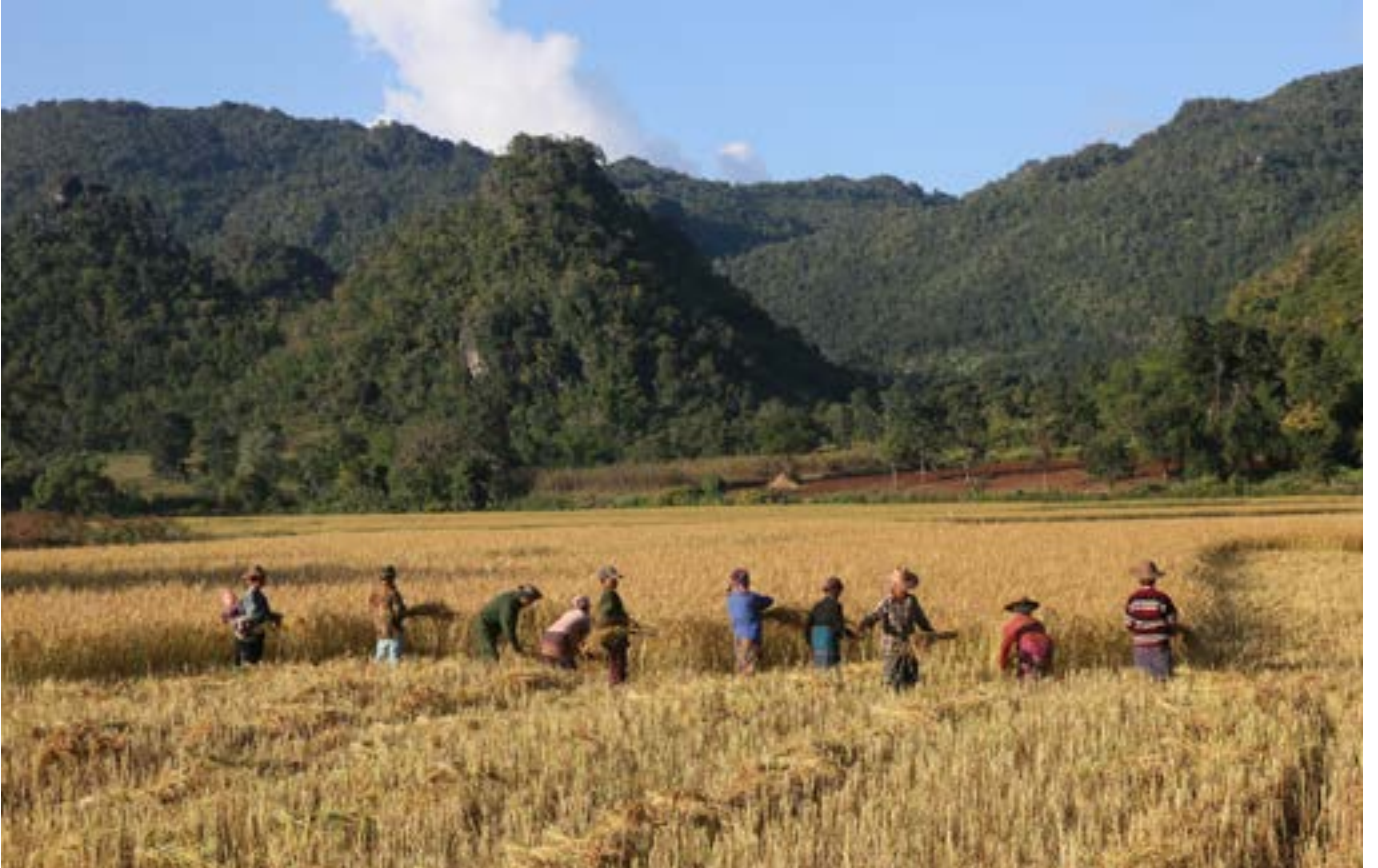
ကယားပြည်နယ်၊ ကျိုင်းတုံရွာ လူထုများ စုပေါင်းစပါးရိတ်သိမ်းခြင်း၊ စပါးစိုက်မြေသည် တစ်ဦးချင်းပိုင်ဖြစ်ပြီး နောက်ခံတွင် ရပ်ရွာပိုင်သစ်တောဖြစ်သည်။

စာပေများကို ပြုစုရာတွင် ဓလေ့ထုံးတမ်းဆိုင်ရာ အကြောင်းအရာများကိုသာ ရှင်းလင်းစွာ ဦးတည်ရေးသားထားပြီး (သို့) ဆက်စပ်အကြောင်းအရာများဖြစ်သည့် မြေယာအသုံးချမှု ပြောင်းလဲမှုများ၊ မြေယာပဋိပက္ခများ၊ မြေယာအခွင့်အရေးများကို ဥပဒေအရ အသိအမှတ်ပြုခြင်း စသည့်အကြောင်းအရာများ ပါဝင်၍ မကြာမှီက ထုတ်ဝေထားသည့် စာပေများကိုသာ ဦးစားပေးခဲ့သည်။ မြန်မာနိုင်ငံတွင် လက်ရှိဖြစ်ပွားနေသည့်ဥပဒေနှင့် မူဝါဒဆိုင်ရာ ပြုပြင်ပြောင်းလဲမှုများကို တုံ့ပြန်သည့်အနေဖြင့် ဓလေ့ထုံးတမ်းဆိုင်ရာ လုပ်ကိုင်ပိုင်ဆိုင်မှုနှင့် ပတ်သက်သော လေ့လာမှုများစွာကို ပညာရှင်များ၊ ဒေသခံများ နှင့် နိုင်ငံတကာမှ အစိုးရမဟုတ်သော အဖွဲ့အစည်းများ၊ နှစ်ဖက်သဘောတူဖွံ့ဖြိုးရေးအေဂျင်စီများနှင့် ကုလသမဂ္ဂအဖွဲ့အစည်းများ 1 မှ ပြုလုပ်ခဲ့သည်။ သင့်လျော်သည့်နေရာများတွင် အဆိုပါ လေ့လာမှုများကို အခြားနိုင်ငံများတွင် ယခင်က ပြုလုပ်ခဲ့သည့် သမိုင်းဆိုင်ရာ နှင့် မနုဿဗေဒဆိုင်ရာ စာပေများနှင့် နှိုင်းယှဉ် ဖြည့်စွက်ထားသည်။