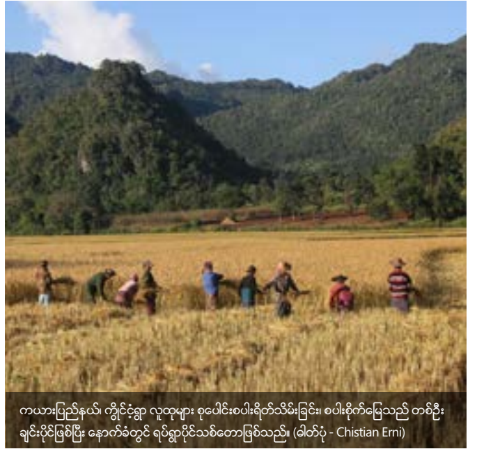
ကယားပြည်နယ်၊ ကျိုင်းတုံရွာ လူထုများ စုပေါင်းစပါးရိတ်သိမ်းခြင်း၊ စပါးစိုက်မြေသည် တစ်ဦးချင်းပိုင်ဖြစ်ပြီး နောက်ခံတွင် ရပ်ရွာပိုင်သစ်တောဖြစ်သည်။

ဖော်ပြပါ လူ့အဖွဲ့အစည်းများ၏ ဓလေ့ထုံးတမ်းဆိုင်ရာ လုပ်ကိုင်ပိုင်ဆိုင်မှုများမှာ ရှုပ်ထွေးခြင်း၊ အမြဲရွေ့လျားနေခြင်း၊ မရှင်းလင်းခြင်း နှင့် နယ်နိမိတ် ရွေ့နေခြင်း (ဒီရေကြောင့် မြေယာများ ပင်လယ်သို့ပါဝင်သွားခြင်း) တို့အပြင် အမဲလိုက်ခြင်းနှင့် ပစ္စည်းစုဆောင်းခြင်းတို့သည် ရေအောက်မြေပြင်တွင် ဖြစ်ပွားလေ့ရှိခြင်း (မျိုးစိတ်များပြားသည့် သန္တာကျောက်တန်းများတွင်) စသည်တို့ကြောင့် ၎င်းတို့၏ ဓလေ့ထုံးတမ်းဆိုင်ရာများကို အသိအမှတ်ပြုရန် နှင့် ကာကွယ်ရန်အတွက် သုတေသနများကို ပိုမိုလုပ်ဆောင်ရန် လိုအပ်နေသည်။