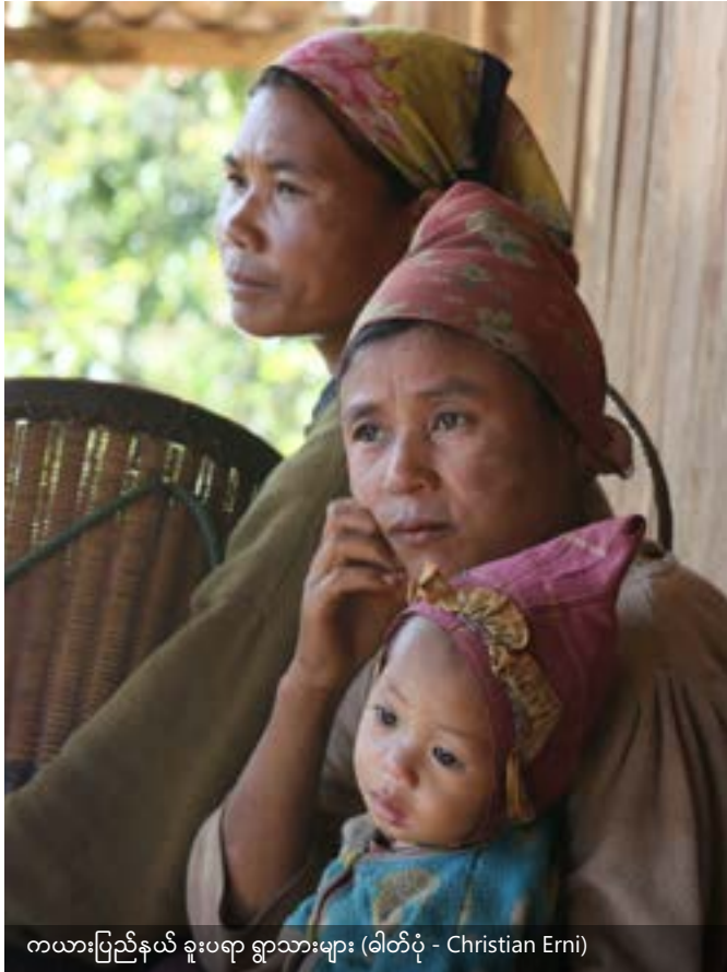
ကယားပြည်နယ် ခူးပရာ ရွာသားများ

ကရင်ပြည်နယ်ရှိ မေးမြန်းဖြေဆိုသူ - ပိုးကရင် 6