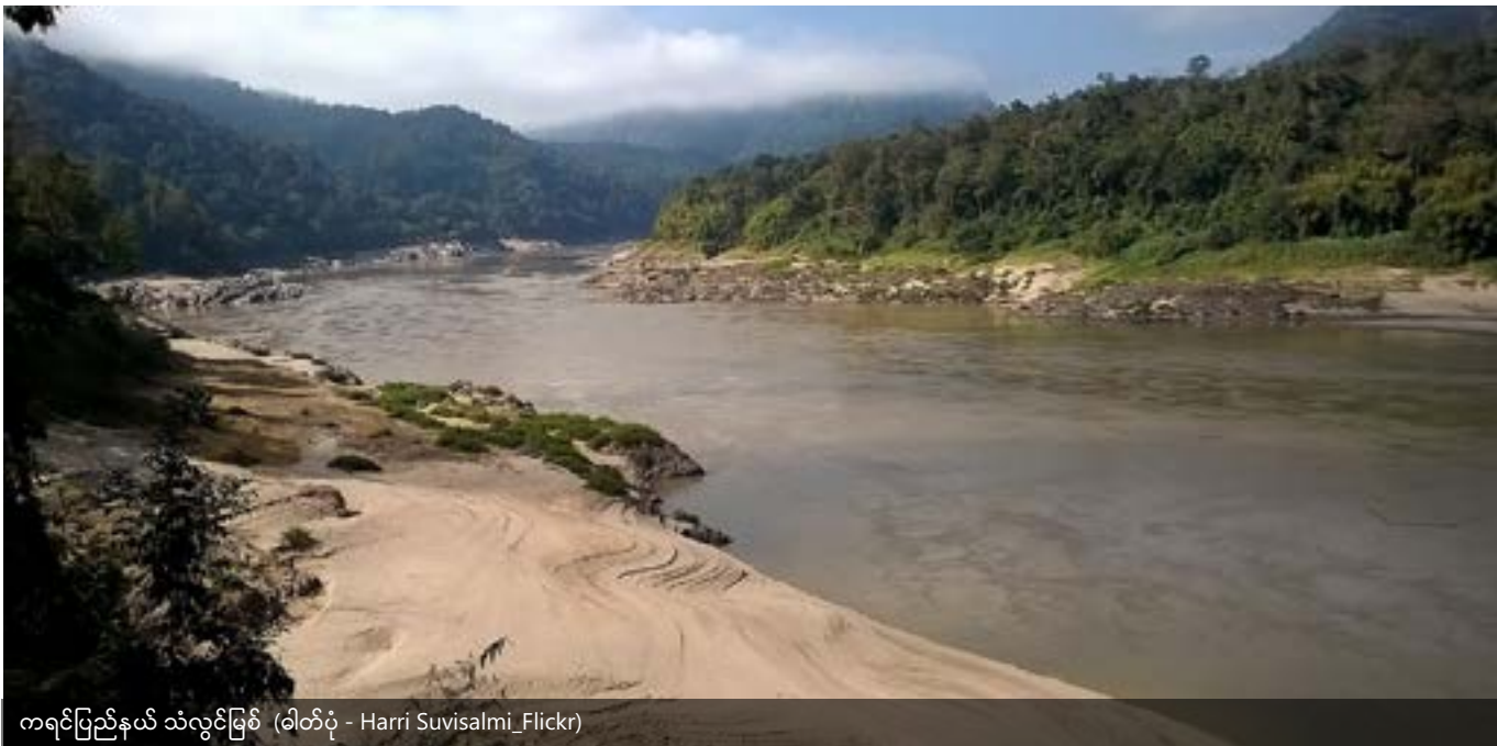
ကရင်ပြည်နယ် သံလွင်မြစ်

ငြိမ်းချမ်းရေးပန်းခြံ၏ ပြဋ္ဌာန်းချက်တွင် ကောမြေအား ကာကွယ်ရန် နှင့် ပြန်လည်အားကောင်းလာစေရန် ဖော်ပြ ထားသည်။ ထိုသို့ပြုလုပ်ခြင်းဖြင့် ကရင်လူမျိုးများ၏ မြေယာအခွင့်အရေးများကို ကာကွယ်ရန်သာ မဟုတ်ဘဲ သဘာဝပတ်ဝန်းကျင်ထိန်းသိမ်းရေးနှင့် မိမိကိုယ်ကို ဖူလုံသော ကရင်လူမျိုးများ၏ အလေ့အကျင့်များကို ထိန်းသိမ်း နိုင်သည့် ကော အုပ်ချုပ်ရေး အဖွဲ့အစည်းများမှ သမိုင်းကို သက်သေပြရန်လည်းဖြစ်သည်။ ထိုသို့ ပြုလုပ်ရာတွင် တိုင်းရင်းသားများ၏ ဓလေ့ထုံးတမ်းအရ လုပ်ကိုင်ပိုင်ဆိုင်မှုများကို အာမခံချက်ပေးနိုင်ရန်အတွက် အမျိုးသား မြေယာဥပဒေတွင် ထည့်သွင်းဖော်ပြရန် ရေးဆွဲခဲ့ ပြီး ၂၀၁၆ ခုနှစ်တွင် အတည်ပြုခဲ့သော အမျိုးသားမြေအသုံးချ မှု မူဝါဒ ကို ကိုင်ဆွဲ၍ မြန်မာအစိုးရအား ထောက်ပြထားသည်။ 50