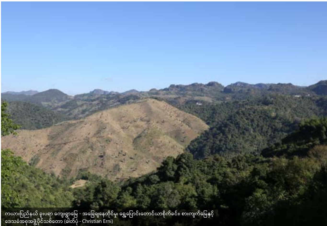
ကယားပြည်နယ် ခူးပရာ ကျေးရွာခြေ - အခြေချနေထိုင်မှု၊ ရွှေ့ပြောင်းတောင်ယာစိုက်ခင်း၊ စားကျက်မြေနှင့် ဒေသခံအစုအဖွဲ့ပိုင်သစ်တော