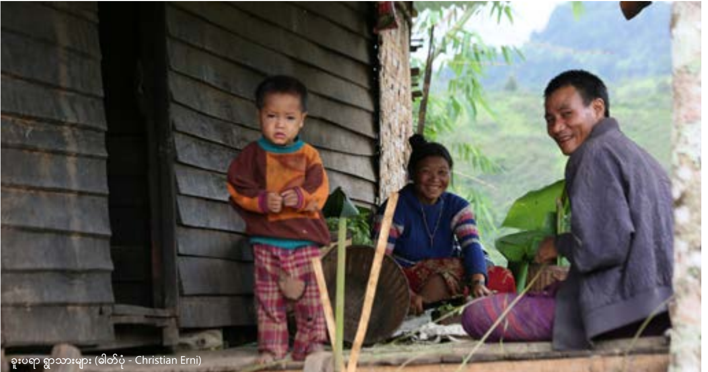
ခူးပရာ ရွာသားများ

ရွှေ့ပြောင်းတောင်ယာအားလုံးသည် အစုအဖွဲ့ပိုင်မြေများဖြစ်ပြီး မိသားစုတိုင်းသည် တစ်နှစ်လျှင် တစ်ကွက် စိုက်ပျိုးခွင့်ရှိသည်။ မြေရှင်းလင်းခြင်း မစတင်မှီ စိုက်ခင်းကွက်များကို အားလုံး၏သဘောတူညီချက်ဖြင့် ဇန်နဝါရီလတွင် ပြုလုပ်သည့် ကျေးရွာ အစည်းအဝေးတွင် ဆုံးဖြတ်သည်။