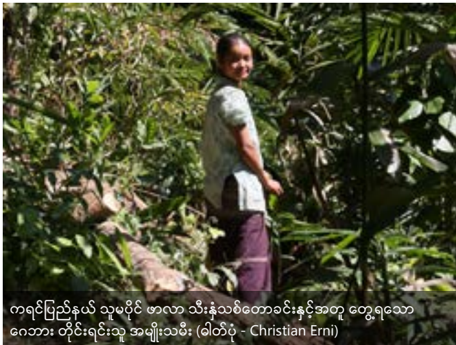
ကရင်ပြည်နယ် သူမပိုင် ဖာလာ သီးနှံသစ်တောခင်းနှင့်အတူ တွေ့ရသော ဂေဘား တိုင်းရင်းသူ အမျိုးသမီး

ဆောင်ရွက်နေခြင်းက ဓလေ့ထုံးတမ်းဆိုင်ရာ လုပ်ကိုင်ပိုင်ဆိုင်မှု စနစ်ကို အားနည်းစေပြီး အစုပိုင်မြေများကို အာဏာပိုင်များမှ သိမ်းခြင်း၊ တစ်သီးပုဂ္ဂလရင်းနှီးမြှုပ်နှံမှုတိုးပွားလာပြီး စိုက်ပျိုးရေးကို စီးပွားရေးလက်ကိုင်ထားခြင်းနှင့် စိုက်ပျိုးရေးဆိုင်ရာ ကွဲပြားမှုများနှင့် ကြံ့ကြံ့ခံနိုင်စွမ်းများ ဆုံးရှုံးခြင်းစသည် အကျိုးဆက်များကို ဒေသခံများ ခံစားရနိုင်သည်။