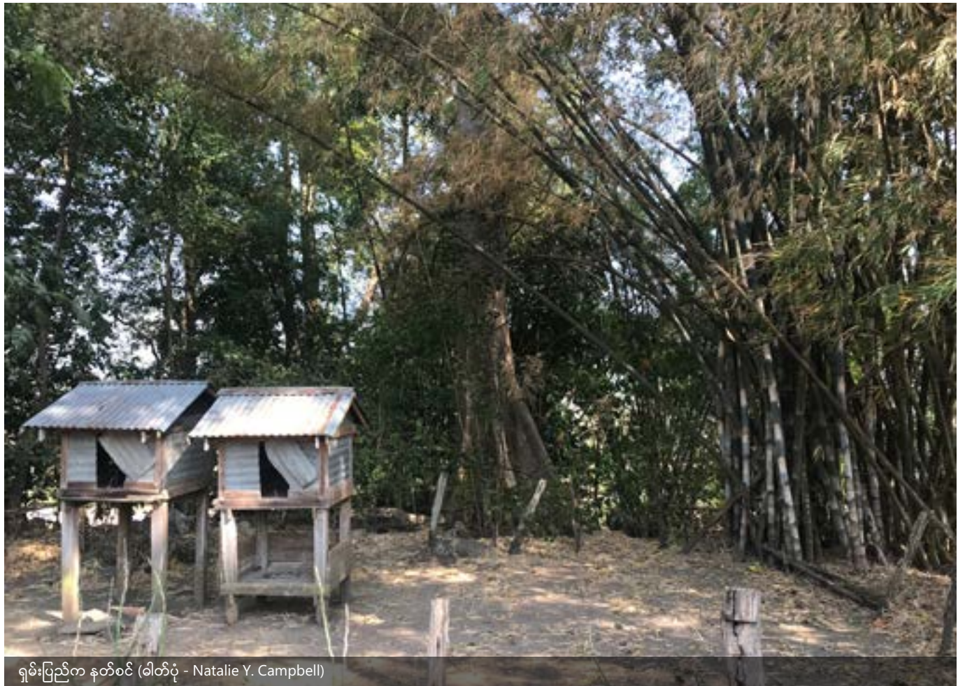
ရှမ်းပြည်နယ် နတ်စင်

စိုက်ပျိုးရန်အတွက် ရှင်းလင်းထားသည့် မြေများကို လွတ်လပ်စွာ အသုံးပြုခွင့်ကို ကျေးရွာတည်ထောင်သူများ၏ မျိုးဆက်များ (သို့) ကျေးရွာအတွင်းသို့ အထူးမွေးစားခံရသည့် မိသားစုများ၏ မျိုးဆက်များက ရရှိသည်။ အဆိုပါ မိသားစုများသည် ကျေးရွာ၏ ဘာသာရေးခေါင်းဆောင်များမှ သာသနာမြေကို ရွေးချယ်ပြီးနောက်တွင် ကျန်ရှိသည့် မြေများထဲမှ ဦးစွာ ရွေးချယ်ခွင့် ရှိသည်။ ထိုမိသားစုများ ရွေးချယ်ပြီးနောက်တွင် မြေယာနှင့်ပတ်သက်၍ တောင်းဆိုခွင့်မရှိသည့် မိသားစုများ၏ မျိုးဆက်များမှ စိုက်ပျိုးရန်မြေကို ရွေးချယ်ကြရသည် ။