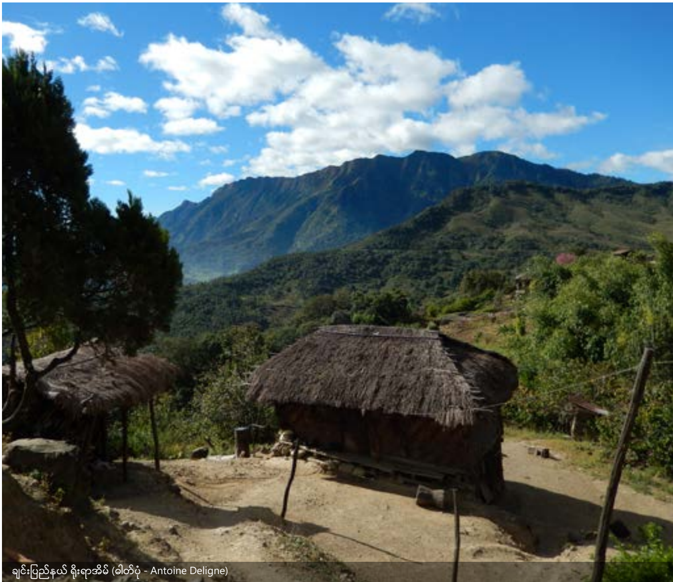
ချင်းပြည်နယ် ရိုးရာအိမ်

ကြာမြင့်စွာ မြေလပ်ထားသည့် ရွှေ့ပြောင်းတောင်ယာစနစ်ကို အသုံးပြုသည့် အခြားသော မြေလုပ်ကိုင်ပိုင်ဆိုင်ခွင့် ပုံစံကို ကယားပြည်နယ် ကယန်းလှတီးတွင် မှတ်တမ်းပြုစုထားပြီး ထိုအကြောင်းအရာကို နောက်လာမည့် ဖြစ်ရပ်ဆန်းစစ်လေ့လာမှုတွင် ဖော်ပြထားသည်။