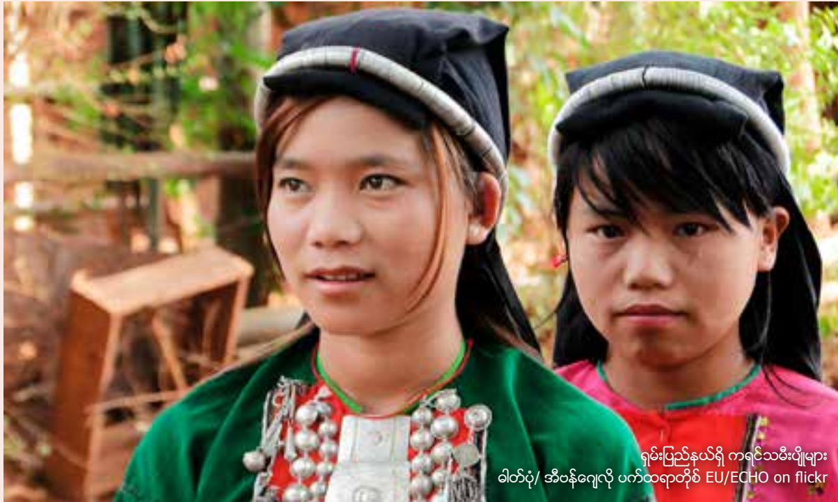
ရမ်းပြည်နယ်ရှိ ကရင်သမီးမျိုးများ

စောညွန့်သောင်းက အမျိုးသမီး ဂျာနယ်လစ်များလိုအပ်မှုကိုအထူးပြုပြော ဆိုသည်။ “အမျိုးသမီးတွေဆီက သတင်းတွေပိုရဖို့လိုသလို အမျိုးသမီးတွေရဲ့အမြင်ကနေ သတင်းတွေပိုရဖို့လိုတယ်။ အမျိုးသမီးတွေက မျိုးဆက်ပွားကျန်းမာရေးပြဿနာတွေ၊ အကြမ်းဖက်မှုဖြစ်ရပ်တွေကို အမျိုးသားဂျာနယ်လစ်တွေနဲ့ အသေးစိတ် ဆွေးနွေးလိုစိတ်မရှိကြဘူး။ ဒါကြောင့်ပဲ အမျိုးသမီးကိစ္စရပ်တွေ၊ အမျိုးသမီးများအပေါ် အကြမ်းဖက်မှုတွေကို ဖော်ထုတ်ဖို့ အမျိုးသမီးဂျာနယ်လစ်တွေ များများလိုတယ်။”