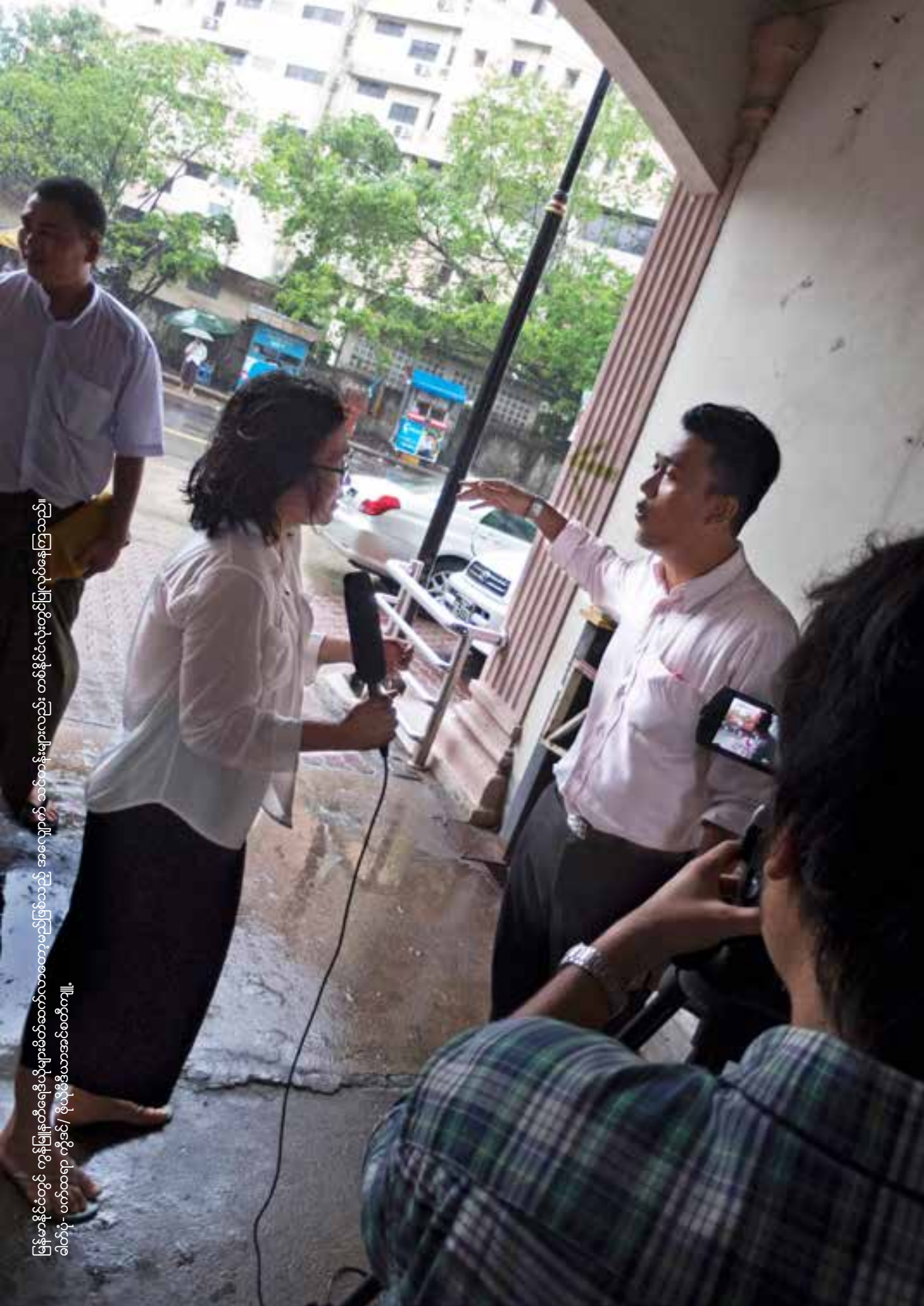
ပြန်မာနိုင်ငံတွင် ကွန်ပျူတာရေးဒီဇိုများမိတ်ဆက်လာထောပည်ဖြစ်သည့် အလျှောက် သင်တန်းများလည်း တစ်နိုင်လုံးတွင်ပြုလုပ်နေကြသည်။