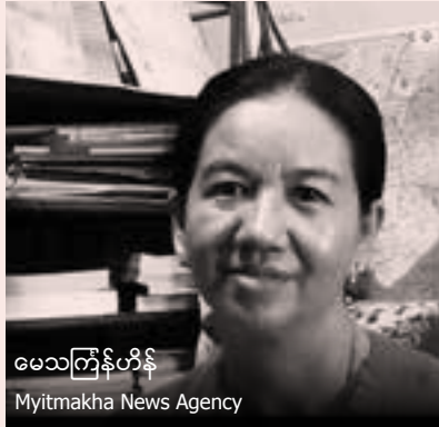
မေသကြိန်ဟိန် Myitmakha News Agency

ကိုတောင်းဆိုသော ဆောင်းပါးများကို ရေးသားထုတ်ဝေခဲ့သည်။ မြန်မာနိုင်ငံတွင် ငှက်တုပ်ကွေးရှာဖွေတွေ့ရှိမှုကို ရေးသားခဲ့သော်လည်း ဌာနဆိုင်ရာများက သေစေနိုင်သောပိုင်းရပ်စ်သည် ဤနိုင်ငံတွင်မရှိကြောင်း ချေပခဲ့ကြသည်။ မေ၏ကြိုးစားအားထုတ်နှင့် (WHO) အပါအဝင် နိုင်ငံတကာ အဖွဲ့ များမှ ဖိအား ကြောင့် အစိုးရကို ဝိုင်းရပ်ပိုးတွေ့ရှိကြောင်း ဝန်ခံရန်ဖိအားပေးနိုင်ခဲ့သည်။ ရလဒ်အဖြစ် မေ၏အမည်ကို အစိုးရ၏ ဘလက်လစ် စာရင်းတွင်ထည့်သွင်းခံခဲ့ရသည်။