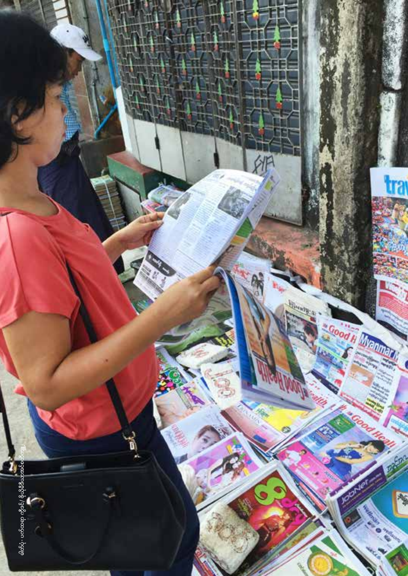
ရည်ညွှန်း - ပတ်ဝန်းကျင်ဆိုင်ရာ လူမှုဝန်ထမ်း / မြန်မာ့နိုင်ငံတော်