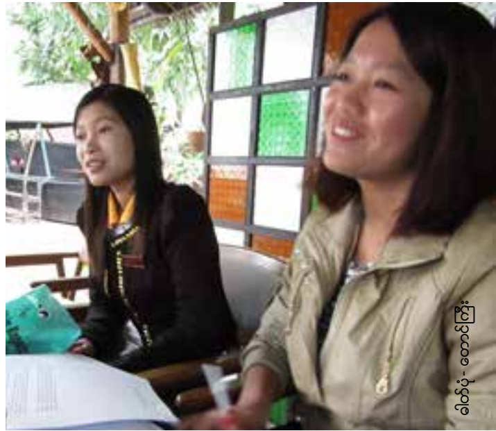
ရိတ်ပုံ - တောင်ကြီး

ဤစစ်တမ်းကို အောက်ပါအဓိက သုတေသနမေးခွန်းများအတွက် အဖြေရရန် စီစဉ်ရေးဆွဲထားခြင်းဖြစ်သည်။