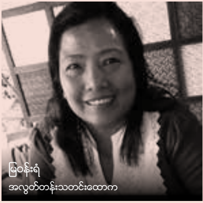
မြဝန်းရံ အလွတ်တန်းသတင်းထောက်

အမျိုးသမီးဂျာနယ်လစ်များအတွက် အထူးသဖြင့် အရေးကြီးကြောင်းနှင့် သူမ၏မျှော်လင့်ချက်မှာ နောင်အနာဂတ် တွင်မိသားစုဝင်များ၏နားလည်မှု ပိုမိုတိုးပွား လာစေရန်ဖြစ်ကြောင်း မြက အထူးပြုပြောဆိုသည်။