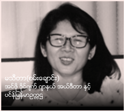
မသီတာ(စမ်းချောင်း) အင်မီဒီယံဂျာနယ် အယ်ဒီတာ နှင့် ပင်န်မြန်မာ့ဥက္ကဋ္ဌ

သင်ကြားမှုအခွင့်အရေးများနှင့် ဂျာနယ် လစ်ဇင်ပညာရေးသည်သင့်တင့်လျောက် ပါတ်မှု နှင့် လုံလောက်မှု မရှိကြောင်းကို မသီတာ(စမ်းချောင်း) ကပြောကြားသည်။