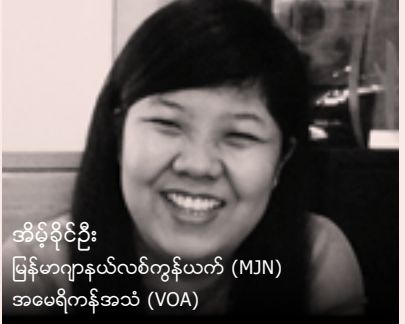
အိမ်ခိုခင်း မြန်မာ့ဂျာနယ်လစ်ကွန်ယက် (MJN) အမေရိကန်အသံ (VOA)

ကြပါတယ်။ နွားဥပဒေလိုခေါ်တယ်။ တရားမျှတမှုကို ပြင်းပယ်ထားတဲ့ ဒီဇုန်ဥပဒေနဲ့ ပါတ်သက်ပြီး အဖွဲ့တစ်ခုက စုပေါင်းလက်မှတ် ထိုးပြီး လွှတ်တော်ကိုတင်ထားတယ်။ တရားဥပဒေကိုက အမျိုးသမီးတွေ ကိုနှိမ်တဲ့ သဘာဝ ရှိတာကြောင့် အမျိုးသားတွေက အမျိုးသမီးတွေကို အလေးမထားတဲ့ နက်နက် ရိုင်းရိုင်းအမြစ်တွယ်နေတဲ့ ဘက်လိုက်မှု ကိုလည်းချက်ချင်းလက်ငင်း သတင်းခန်းမှာ ထင်ဟပ်တာပဲ”။