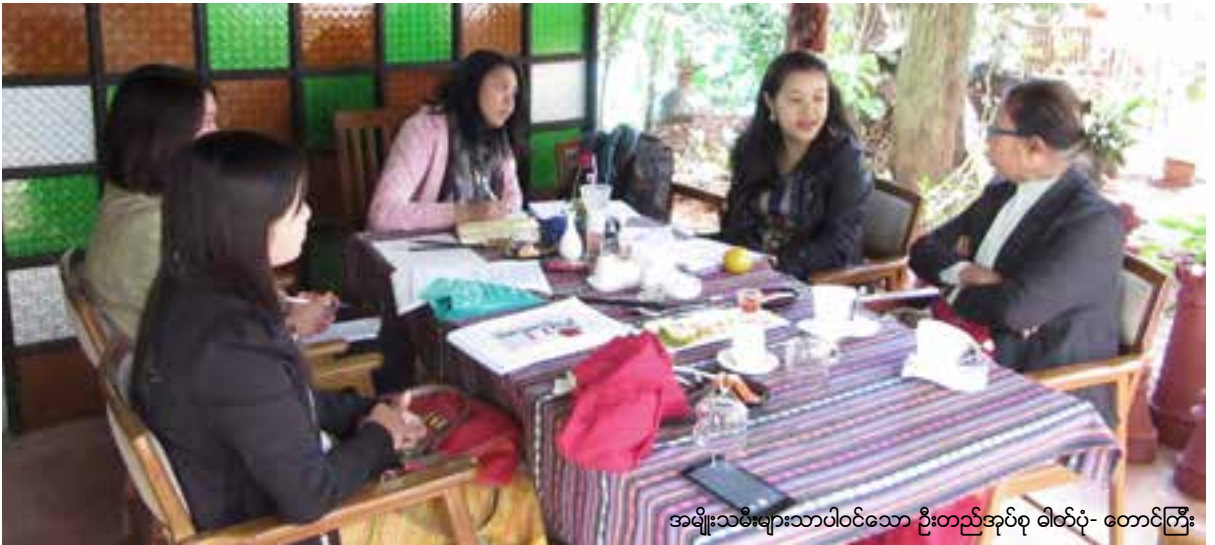
အမျိုးသမီးများသာပါဝင်သော ဦးတည်အုပ်စု ဓါတ်ပုံ- တောင်ကြီး

၂၀၀၈ ဖွဲ့စည်းပုံအခြေခံဥပဒေတွင် အစိုးရအဖွဲ့အတွင်း အမျိုးသမီးကိုယ်စားလှယ်များအတွက် နေရာသတ်မှတ်ပေးခြင်း မရှိသည့်အပြင် အချို့နေရာများကို အမျိုးသားများအတွက် ကြိုတင်ပြီးသတ်မှတ်ထားသည်မှာ နိုင်ငံရေး တွင် အမျိုးသမီးများ ပါဝင်မှုကို ကန့်သတ်ထားကြောင်း သိသာလှသည်။ ၂၀၁၆ နိုဝင်ဘာလ ရွေးကောက်ပွဲ ရလဒ်အရ အသစ်ရွေးကောက်ခံ လွှတ်တော်အဖွဲ့ဝင် ၁၃ ရာခိုင်နှုန်းမှာ အမျိုးသမီးများဖြစ်ပြီး ယခင် ၄.၆ ရာခိုင်နှုန်းမှတိုး လာခဲ့ခြင်းဖြစ်သည်။ ယင်းအထဲတွင် တပ်မတော်မှ ကြိုတင်ယူထားသော နေရာများပါဝင်သဖြင့် စုစုပေါင်းအရေအတွက်၏ ၉.၇% ရာခိုင်နှုန်းကို သာ အမျိုးသမီးများက ရရှိထားသည်ဟု ဆိုနိုင်သည်။ ၃