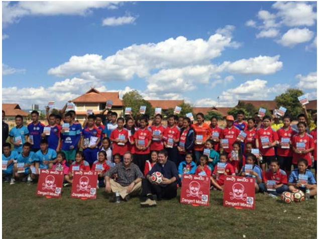
ການສະໜັບສະໜູນກິດຈະກຳໂຄສະນາສຶກສາຄວາມສ່ຽງຈາກ ລບຕ ແລະ ທົບທວນຄືນຄວາມເຂົ້າໃຈຂອງນັກຮຽນ ກອນ ແລະ ຫຼັງ ການເຮັດກິດຈະກຳໂຄສະນາສຶກສາຄວາມສ່ຽງຈາກ ລບຕ.