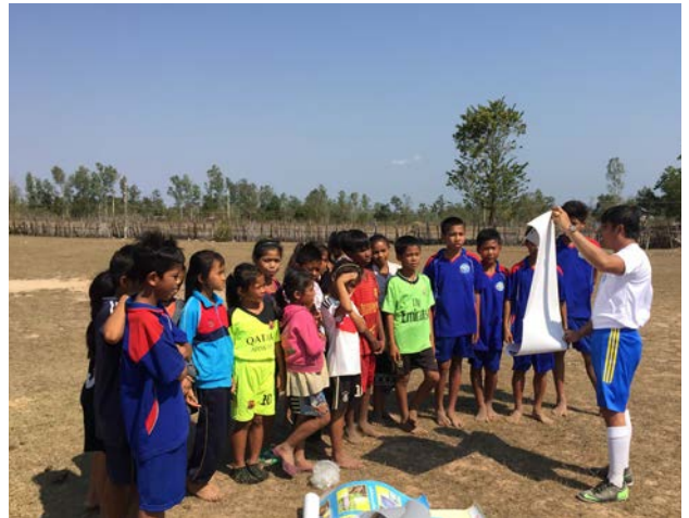
ກິດຈະກຳໂຄສະນາສຶກສາຄວາມສ່ຽງຈາກ ລບຕ ຢູ່ສະໜາມເຕະບານບານ ແລະ ຫຼີ້ນເກມໄປພອມ.