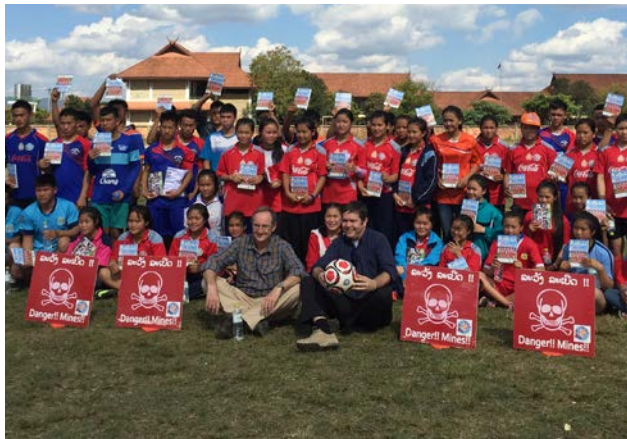
ນາງ ເມືອງ ເປັນພະນັກງານພົວພັນຊຸມຊົນຂອງອົງການເຮໂລ ກໍາລັງດໍາເນີນກິດຈະກໍາໂຄສະນາສຶກສາຄວາມສຽງຈາກ ລບຕ ໃຫ້ເດັກນ້ອຍຢູ່ບານນາຊິມພູ.

ໃນນາມເປັນອົງການປະຕິບັດງານເພື່ອມະນຸດສະທໍາໜຶ່ງ, ວຽກງານສໍາຫຼວດ ແລະ ກວດກາ ລບຕ ແລະ ໂຄສະນາສຶກສາຄວາມສຽງຈາກ ລບຕ ຈຶ່ງຈໍາເປັນຕ້ອງໄດ້ສືບຕໍ່ປະຕິບັດຢູ່ບັນດາບານຕ່າງໆທີ່ມີຜົນກະທົບ. ໃນປີ 2015 ເຮໂລ ໄດ້ນໍາໃຊ້ຂໍ້ມູນບູລິມະສິດ ປະສິມປະສານກັບ ຂໍ້ມູນ CHA ແລະ ນໍາມາວາງແຜນໃຫ້ສອດຄ່ອງກັບແຜນພັດທະນາເສດຖະກິດ-ສັງຄົມ.