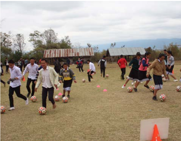
ເດັກນ້ອຍ ພະຍາຍາມຝຶກຊ້ອມຫຼອກບານໄປມາຢູ່ໃນພື້ນທີ່ໆບໍ່ມີລບຕ ແລວ, ເຂົາເຈົ້າສາມາດຮຽນກ່ຽວກັບທັກສະໃນການເຕະບານ ແລະ ວິທີການຫຼີກລ່ຽງຈາກ ລບຕ.