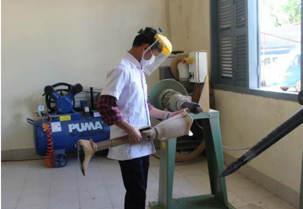
ນັກວິຊາການຜະລິດອົງຄະທຽມ ທີ່ສູນການແພດພື້ນຟູໜ້າທີ່ການກຳລັງຊຽນອົງຄະທຽມໃສ່ອະໄວຍະວະຂາລຸ່ມຫົວເຄົ້າລົງໄປ.