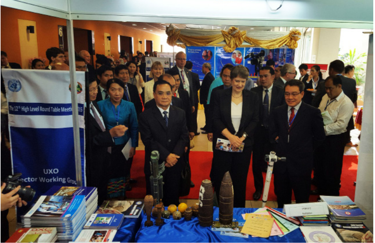
ພະນະທ່ານ ທອງສິງ ທໍາມະວົງ ນາຍົກລັດຖະມົນຕີແຫ່ງ ສປປ ລາວ ພ້ອມດ້ວຍຜູ້ແທນກອງປະຊຸມ ໂຕະມົນລະດັບສູງ ທີ່ມາຈາກບັນດາປະເທດຕ່າງໆໃນທົ່ວຢູໂຣປ ແລະ ອາຊີ ຍົງມຸ່ມຢາມບູດວາງສະແດງວຽກງານແກ້ໄຂບັນຫາ ລບຕ ຢູ່ໃນ ສປປ ລາວ.