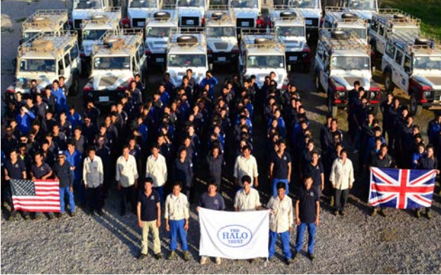
ພະນັກງານທັງໝົດໃນໂຄງການໃນປີ 2014.

ສົງຄາມ. ຢູ່ສປປ ລາວ ເຮໂລ ໃຫ້ຄໍາພື້ນສັນຍາວ່າ ຈະສະໜັບສະໜູນລັດຖະບານລາວ ຢ່າງເຕັມທີ່ ເພື່ອບັນລຸເອ້ມດີຈີ 9.