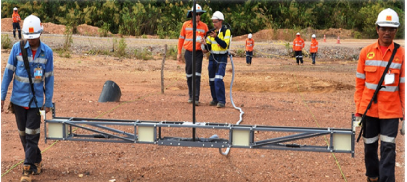
ຜົນສໍາເລັດການສ້າງຂີດຄວາມສາມາດໃຫ້ພະນັກງານໃນປີ 2015: