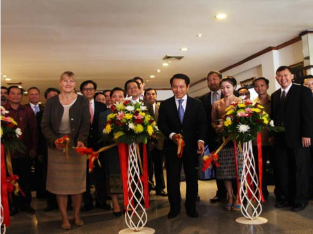
ພິທີຕັດແຖບຜ້າ ເມືອງໃນໂອກາດສະເຫຼີມສະຫຼອງວັນທີ 1 ສິງຫຼາ ຂອງການຄົບຮອບ 5 ປີ, ວັນມີຜົນບັງຄັບໃຊ້ສົນທິສັນຍາຕ່ານລະເບີດລູກຫວານ.

ໂຄສະນາລະດົມຂົນຂວາຍໃຫ້ບັນດາປະເທດຕ່າງໆໃນໂລກເຂົ້າຮ່ວມລົງນາມ ແລະ ເປັນພາຄີຂອງສົນທິສັນຍາດັ່ງກ່າວ. ໃນການແຂ່ງຂັນ ປະກອບມີ ການແຂ່ງຂັນເຕະບານ ແລະ ຕີໝາກບູນ, ຈັດຂຶ້ນທີ່ໂຮງຮຽນຊັບພະວິຊາຊີນກາງ ເຂົ້າຮ່ວມໂດຍຕ່າງໜ້າບັນດາກະຊວງ, ບັນດາອົງການປະຕິບັດງານ, ບໍລິສັດກວດກຸລບຕທັງລາວ ແລະ ຕ່າງປະເທດ ແລະ ພາກສ່ວນອື່ນໆທີ່ກ່ຽວຂ້ອງເຂົ້າຮ່ວມແຂ່ງຂັນ ລວມທັງໝົດປະມານ 250 ທ່ານ, ຊຶ່ງເຫັນໄດ້ບັນຍາກາດທີ່ພົດພົນ ແລະ ຄວາມມວນຊື່ນໄປພ້ອມໆກັບຜົນສໍາເລັດທີ່ຍາດມາໄດ້ຕະຫຼອດປີທີ່ຜ່ານມາ.