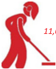
11,699 ຕາແມັດ ແມ່ນປອດໄພຈາກ ລບຕ

ອົງການດີພິດ ໄດ້ສະໜັບສະໜູນທຶນກວດກຳຂອງອົງການແມັກ ແລະ ເຂົ້າໄປດໍາເນີນການກວດກຳ ລບຕ ໃນເຂດພື້ນທີ່ໂຮງຮຽນ ໃນວັນທີ 8 ເມສາ 2015 ເພື່ອເຮັດໜ້າທີ່ກວດກຳ ແລະ ທຳລາຍ ລບຕ ໃຫ້ໄວເທົ່າທີ່ຈະໄວໄດ້ ເພື່ອຮັກສາຊີວິດຂອງນັກຮຽນ.