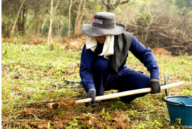
ທີມກວດກູ້ຍິງຂອງອົງການແມັກຢູ່ທີ່ແຂວງຊຽງຂວາງ ກຳລັງໃຊ້ ສຽມຈິມດິນຢ່າງລະມັດລະວັງ ເພື່ອຊອກຫາ ລບຕ.

ໃນປີ 2015, ພະນັກງານພົວພັນຊຸມຊົນ ໄດ້ລົງດຳເນີນການສຳ ຫຼວດບໍ່ແມ່ນວິຊາການຢູ່ໃນ 37 ບ້ານ. ໃນຊ່ວງທີ່ລົງເຄື່ອນໄຫວ ນັ້ນ ຊາວບ້ານແຕ່ລະຄົນແມ່ນໄດ້ເຂົ້າມາມີສ່ວນຮ່ວມໃນການ ໃຫ້ຂໍ້ມູນກ່ຽວກັບຈຸດຫຼັກຖານ ລບຕ ຕົກຄ້າງທີ່ເຂົາເຈົ້າເຄີຍເຫັນ ມາກອນ. ວິທີການທີ່ພະນັກງານພົວພັນຊຸມຊົນນຳໃຊ້ແມ່ນປະ