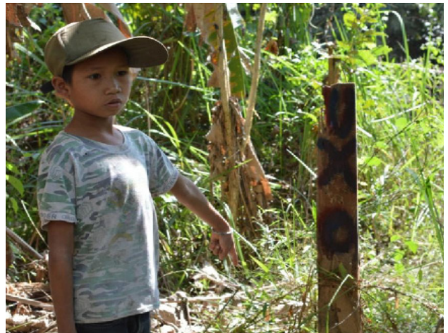
ຢູ່ບ້ານເມືອງຈັນ. ພາຍຫຼັງທີ່ດໍາເນີນກິດຈະກຳໂຄສະນາສຶກສາຄວາມສູງຈາກ ລບຕ, ມີເດັກນອຍໄດ້ລາຍງານວ່າພົບເຫັນລບຕ ຕອນທີ່ໄປລາໝູ່ຢູ່ໃນປ່າ.