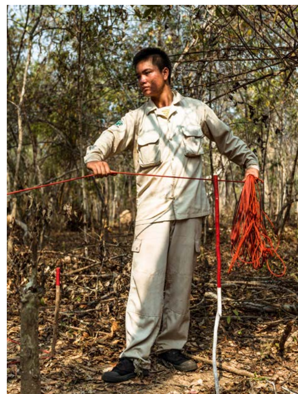
ອົງການເອັນພີເອ ກຳລັງກະກຽມສະໜາມເພື່ອເຮັດການສຳຫຼວດ.

ເມືອງບົວລະພາ ແມ່ນເມືອງທີ່ມີຜົນກະທົບໜັກຈາກ ລູບຕຢູ່ແຂວງຄຳມ່ວນ. ອົງການແມັກແມ່ນອົງການທີ່ເຮັດວຽກແກ່ໄຂບັນຫາ ລູບຕ ມາຫຼາຍປີເມືອງແຫ່ງນີ້ ແລະ ມີຂໍ້ມູນການທົ່ວລາຍ ລູບຕ ເຄືອນທີ່ເປັນຈຳນວນຫຼາຍ ແລະ ໜ້າເຊື່ອຖືໄດ້ ແຕ່ອາດິດຈົນຮອດປີ 2008. ພາຍໃຕ້ໂຄງການດັ່ງກ່າວ ອົງການເອັນພີເອ ຈະນຳໃຊ້ຂໍ້ມູນການທຳລາຍ ລູບຕ ເຄືອນທີ່ເຂົ້າໃນຂະບວນການສຳຫຼວດ ລູບຕ ເພື່ອຫຼີກລ່ຽງການສຳຫຼວດຊອກຫາ ລູບຕ ໃນພື້ນທີ່ຮ້າຮຸ່ວາມີ ລູບຕ ຕົກຄາງແລ້ວ. ຫຼັງຈາກນັ້ນ, ອົງການແມັກ ຈະນຳເອົາຂໍ້ມູນຈາກອົງການເອັນພີເອ ໄປວາງແຜນການກວດກາ. ນອກຈາກນັ້ນ, ອົງການເອັນພີເອ ຍັງຈະປະສານສົມທົບກັບອົງການຈັດແບ່ງເພື່ອສາງພິມຮູບເງົາໃນໄຕມາດ 1 ປີ 2016. ພິມດັ່ງກ່າວຈະສະແດງໃຫ້ເຫັນຄວາມສຳຄັນຂອງເພດຍິງໃນການແກ່ໄຂບັນຫາ ລູບຕ.