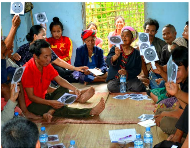
ການປະເມີນເບິ່ງສິ່ງກົດຂວາງຮ່ວມກັບຄົນພິການ ແລະ ຜູ້ລອດຊີວິດຈາກ ລບຕ ຢູ່ເມືອງເຊໂປນ ໃນເດືອນກັນຍາ 2014.

ສຳລັບວຽກໂຄສະນາສຶກສາຄວາມສູງຈາກ ລບຕ ກໍໄດ້ສືບຕໍ່ປະຕິບັດເຊັ່ນດຽວກັນໃນປີ 2015. ອົງການເຫັດໄອ ໄດ້ເຊື່ອມ