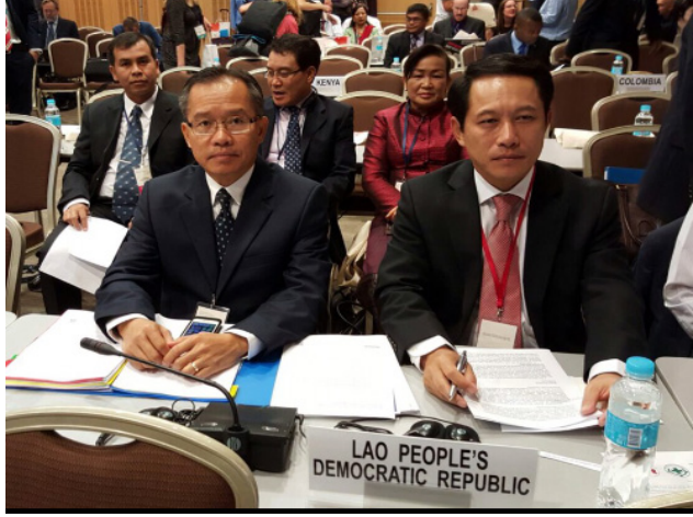
ຄະນະຜູ້ແທນລາວ ເຂົ້າຮ່ວມກອງປະຊຸມທົບທວນຄັ້ງທໍາອິດຂອງສົນທິສັນຍາຕ່ານລະເບີດລູກຫວານ ທີ່ດູໂບນິກ, ປະເທດໂຄເອເຊຍ.

ໃນປີ 2015, ອົງການ ສປຊ ໄດ້ສະໜັບສະໜູນໃນການສ້າງຄວາມອາດສາມາດທາງດ້ານເຕັກນິກວິຊາການໃຫ້ແກ່ທ່ານ ຄຊກລ ແລະ ຄກລ, ຊຶ່ງສະແດງອອກຜົນສໍາເລັດໃນທັງລະດັບກົດຈະກໍາ ແລະ ຜົນໄດ້ຮັບ.