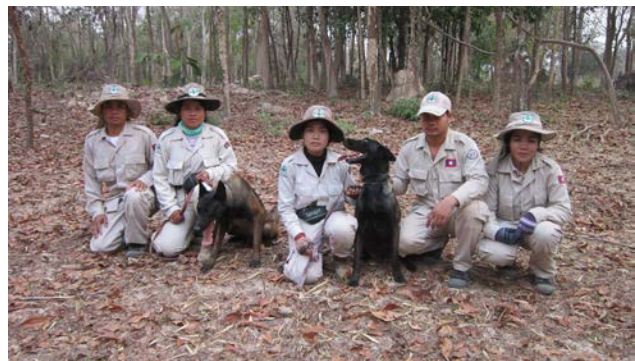
ພະນັກງານຂອງອົງການເອັນພີເອ ກຳລັງໃຊ້ໝາດົມຊອກຫາລະເບີດລູກຫວານ.

ການທົດລອງໃຊ້ໝາດົມລະເບີດ ໄດ້ດຳເນີນຢູ່ແຂວງສາລະວັນ, ຊຶ່ງບົດຮຽນໄດ້ຖອດຖອນມາຈາກອົງການຊື່ແມັກຂອງກຳປູເຈຍ ທີ່ປະສົບຜົນສຳເລັດມາແລ້ວເປັນເວລາຫຼາຍປີຢູ່ບານເພີນ. ການທົດລອງດັ່ງກ່າວນີ້ ແມ່ນເຮັດຮວມກັບ ຄຊກລ ເພື່ອທົດສອບກ່ຽວກັບຄຸນນະພາບ ແລະ ຄວາມຄຸ້ມຄຸ້ມໃນການນຳໃຊ້ໝາດົມລະເບີດລູກຫວານ. ຜົນຈາກການທົດລອງບອກໃຫ້ຮູ້ຄາງວ່າ ໝາສາມາດດົມຊອກຫາລະເບີດລູກຫວານໄດ້ແທ້ແຕ່ບໍ່ສາມາດດົມກິ່ນສິ່ນສວນຂອງ ລບຕ ອື່ນໆໄດ້. ນອກຈາກນັ້ນ, ຍັງສາມາດຮູ້ຕື່ມອີກວ່າ ການນຳໃຊ້ໝາດົມຊອກຫາລະເບີດລູກຫວານ ແມ່ນໃຊ້ຕົນຫຼິ້ນສູງ, ທຽບໃສ່ການນຳໃຊ້ຄົນ. ປະຈຸບັນນີ້ ບົດລາຍງານສຸດທ້າຍແມ່ນກຳລັງຮາງຢູ່ ແລະ ຈະແລກປ່ຽນກັບ ຄຊກລ ແລະ ຄຸ້ມຄຸ້ມປະຕິບັດງານອື່ນໆໃນມື້ນີ້. ແຕ່ເຖິງຢ່າງນັ້ນກໍຕາມ, ອົງການເອັນພີເອ ກໍຍັງຈະສືບຕໍ່ທົດລອງໝາດົມລະເບີດລູກຫວານອີກຕື່ມໃນປີ 2016.