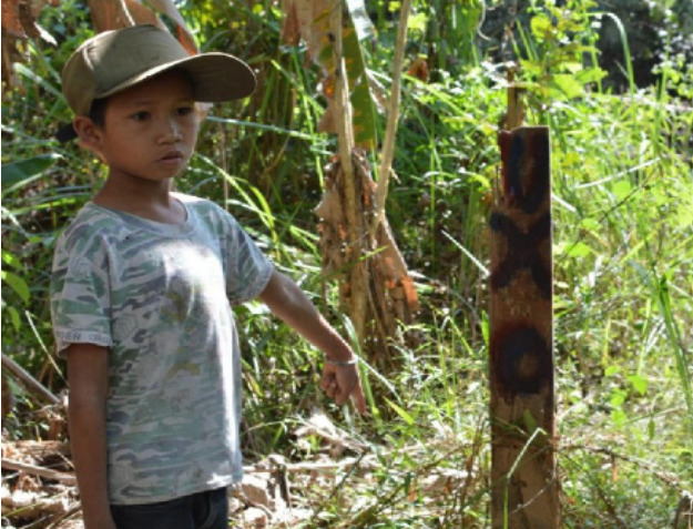
ຢູ່ບ້ານເມືອງຈັນ. ພາຍຫຼັງທີ່ດຳເນີນກິດຈະກຳໂຄສະນາສຶກສາຄວາມສູງຈາກ ລຸບຕ, ມີເດັກນ້ອຍໄດ້ລາຍງານວ່າພົບເຫັນລຸບຕ ຕອນທີ່ໄປລາທູຢູ່ໃນປ່າ.

ສານພະນັກງານໂຄສະນາສຶກສາຄວາມສູງຈາກ ລຸບຕ ເຂົ້າໄປຢູ່ໃນທີມສຳຫຼວດບໍ່ແມ່ນວິຊາການ ເພື່ອເຮັດໜ້າທີ່ໃນການໂຄສະນາສຶກສາຄວາມສູງຈາກ ລຸບຕ ໃນລະຫວ່າງທີ່ດຳເນີນການສຳຫຼວດບໍ່ແມ່ນວິຊາການ. ພະນັກງານໂຄສະນາສຶກສາຄວາມສູງຈາກ ລຸບຕ ຈະໃຫ້ຄວາມຮຽກຮ້ອງກັບຄວາມປອດໄພແກ່ປະຊາຊົນ ໂດຍນຳໃຊ້ປຶ້ມ ແລະ ອຸປະກອນໂຄສະນາເຂົ້າຊ່ວຍໃນການໂຄສະນາໃຫ້ແກ່ເດັກນ້ອຍ ແລະ ຜູ້ໃຫຍ່, ຊຶ່ງປຶ້ມ ແລະ ອຸປະກອນດັ່ງກ່າວນີ້ແມ່ນຖືກພັດທະນາຂຶ້ນໂດຍອົງການເັດໄອ ແລະ ຄຊກລ. ເປົ້າໝາຍຂອງອົງການເັດໄອແມ່ນສຸມໃສ່ “ກຸ່ມສູງ” ເຊັ່ນ: ເດັກນ້ອຍທີ່ບໍ່ທັນຮຽນກັບ ລຸບຕ ແລະ ເດັກນ້ອຍທີ່ບໍ່ຮຽນແມ່ນຫຍັງໃນເວລາທີ່ພົບເຫັນ ລຸບຕ. ການສຳຫຼວດກຽມກັບຄວາມຮູ້, ຫັດສະນະຄະຕິ, ພຶດຕິກຳ (ແຄ້ບ) ໄດ້ດຳເນີນຂຶ້ນເພື່ອວັດແທກຄວາມຮັບຮູ້ຂອງປະຊາຊົນ. ກິດຈະກຳໂຄສະນາສຶກສາຄວາມສູງຈາກ ລຸບຕ (ປະກອບມີການໂຄສະນາກຽມກັບວິທີການຄວາມປອດໄພ ແລະ ສາຍພົມຮູບເງົາ ຢູ່ໃນ 94 ບ້ານ, ຊຶ່ງມີຜູ້ໄດ້ຮັບຜົນປະໂຫຍດ 11,696 ຄົນ ໃນນັ້ນ ຜູ້ຍິງໃຫຍ່ 2,825 ຄົນ (24.1%), ຜູ້ໃຫຍ່ຊາຍ 3,138 ຄົນ (26.8%), ເດັກຍິງ 2,739 ຄົນ (23.4%) ແລະ ເດັກຊາຍ 2,977 ຄົນ (25.4%). ນອກຈາກນັ້ນ, ອົງການເັດໄອ ຍັງໄດ້ເຂົ້າຮ່ວມການຝຶກອົບຮົມຄູ ທີ່ຈັດຂຶ້ນໂດຍກະຊວງສຶກສາທິການ ແລະ ກິລາ. ການຝຶກອົບຮົມດັ່ງກ່າວແມ່ນໃຫ້ຄວາມຮູ້ແກ່ຄູສອນກຽມກັບການສຶກສາຄວາມຮູ້ ແລະ ການນຳໃຊ້ອຸປະກອນໂຄສະນາໃຫ້ມີຄວາມເໝາະສົມ ແລະ ຖືກຕ້ອງ ໃຫ້ແກ່ນັກຮຽນ. ຄູສອນ 301 ຄົນ ໄດ້ເຂົ້າຮ່ວມຝຶກອົບຮົມໃນປີ 2015 ເພື່ອໄປຝຶກສອນໃຫ້ແກ່ນັກຮຽນ 9,352 ຄົນ ຢູ່ໃນ 124 ໂຮງຮຽນຂັ້ນປະຖົມໃນ 3 ເມືອງເປົ້າໝາຍ. ນອກຈາກນັ້ນ, ສາຍດວນແຈກກຽວກັບອຸບັດເຫດ ລຸບຕ ຍັງໄດ້ຖືກນຳສະເໜີໃນເດືອນກໍລະກົດ 2015 ອີກດ້ວຍ ໃນຊ່ວງທີ່ມີການໂຄສະນາສຶກສາຄວາມສູງຈາກ ລຸບຕ ຢູ່ໃນບັນດາບ້ານເປົ້າໝາຍ. ປະຊາຊົນທີ່ພົບເຫັນ ລຸບຕ ສາມາດລາຍງານໂດຍກົງເຖິງອົງການເັດໄອ ເພື່ອສົ່ງທິມງານທຳລາຍເຄື່ອນທີ່ໄປທຳລາຍ ລຸບຕ ໄດ້ຢ່າງທັນການ.