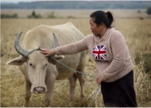
ນາງຄໍາພອນ ກໍາລັງລ້ຽງຄວາຍດ້ວຍຄວາມຮູ້ສຶກທີ່ປອດໄພຢູ່ໃນທົ່ງນາຂອງລາວ.