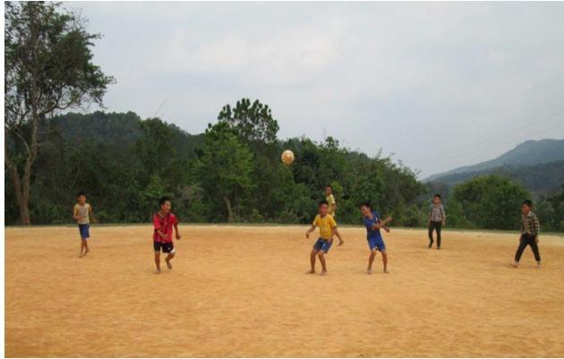
ເດີນເຕະບານໃໝ່ ຫຼັງຈາກທີ່ກວດກູ້ ລບຕ ອອກແລ້ວ (ໂຮງຮຽນປະ ຖົມບ້ານດົງດານ, 8 ເມສາ 2015).

ນອກຈາກນັ້ນ, ທີມງານພົວພັນຊຸມຊົນຂອງອົງການແມັກ ຍັງ ໄດ້ລົງເຄື່ອນໄຫວກິດຈະກຳໂຄສະນາສຶກສາຄວາມສ່ຽງຈາກ ລບຕ ຢູ່ 106 ບ້ານ ເນື່ອງຈາກວ່າ ເດັກນ້ອຍແມ່ນກຸ່ມທີ່ມີຄວາມ ສ່ຽງຕໍ່ການເກີດອຸບັດເຫດຈາກ ລບຕ ຫຼາຍທີ່ສຸດ. ໃນປີ 2015 ມີ ຜູ້ເຂົ້າຮວມກິດຈະກຳໂຄສະນາສຶກສາຄວາມສ່ຽງຈາກ ລບຕ 42,746 ຄົນ ໃນນັ້ນ 32,669 ແມ່ນເດັກນ້ອຍ, 15,827 ແມ່ນ ເດັກຍິງ ໃນໄວອາຍຸ 5 ຫາ 16 ປີ. ນອກຈາກນັ້ນ, ອົງການແມັກ ຍັງໄດ້ຝຶກອົບຮົມໃຫ້ອາສາສະໜັບກບານຢູ່ໃນ 39 ບ້ານ ແນໃສ່ ໃຫ້ເຂົາເຈົ້າເນື້ອໄປຝຶກສອນຕໍ່ຜູ້ຕາມຊຸມຊົນຕ່າງໆພາຍໃນບ້ານ ຂອງເຂົາເຈົ້າ ແລະ ອົງການແມັກ ກໍໄດ້ລົງຕິດຕາມການເຄື່ອນ ໄຫວຂອງເຂົາເຈົ້າເປັນແຕ່ລະໄລຍະ ເພື່ອໃຫ້ການຊ່ວຍເຫຼືອ. ວຽກງານໂຄສະນາສຶກສາຄວາມສ່ຽງຈາກ ລບຕ ແມ່ນສວນໜຶ່ງ ທີ່ຖືກເຊື່ອມສູນເຂົ້າໃນຫຼັກສູດການຮຽນ-ການສອນໃນຊັ້ນປະ ຖົມ ແລະ ໃນຕົ້ນປີ 2016 ອົງການແມັກ ຈະເຮັດວຽກຮ່ວມກັບພະ ແນກສຶກສາ ແລະ ກິລາ ແຂວງຊຽງຂວາງ ເພື່ອຈັດການຝຶກອົບ ຮົມໃຫ້ຄູສອນຢູ່ 33 ໂຮງຮຽນກ່ຽວກັບການສິດສອນວິຊາ ລບຕ ແລະ ການປະຖົມພະຍາບານຂັ້ນຕົ້ນ.